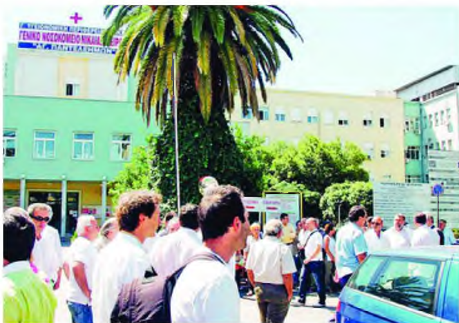
Εικόνα εγκατάλειψης σε μεγάλα νοσοκομεία καταγγέλλουν οι εργαζόμενοι

Μ ε λίγα και πεπαλαιωμένα κλιματιστικά σώματα, αλλά και ασυντήρητους ή ακόμα και χαλασμένους κεντρικούς κλιματισμούς καλούνται να περάσουν τον πρώτο καύσωνα του φετινού καλοκαιριού πολλά δημόσια νοσοκομεία. Όπως καταγγέλλουν οι εργαζόμενοι στα δημόσια νοσοκομεία, ακόμα και μεγάλα νοσοκομεία της Αθήνας παρουσιάζουν εικόνα εγκατάλειψης, αφού αρκετοί θάλαμοι νοσηλείας, χώροι αναμονής ασθενών και ιατρεία δεν έχουν κλιματισμό, με αποτέλεσμα να «επιστρατεύονται» ανεμιστήρες, τους οποίους σε αρκετές περιπτώσεις φέρνουν από το σπίτι τους οι ασθενείς!