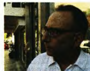
Ο ξάδερφος της άτυχης γυναίκας ξεκαθάρισε πως δεν είχε κανέναν λόγο να βάλει τέλος στη ζωή της