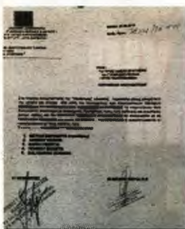
Το έγγραφο που δίνει αρμοδιότητα στις νόμιμες αποκλειστικές να πραγματοποιούν έλεγχους, προκειμένου να εντοπίσουν «παράνομες συναδέλφους» τους

Ο ξάδελφος της άτυχης γυναίκας ξεκαθάρισε πως δεν είχε κανέναν λόγο να βάλει τέλος στη ζωή της, αλλά αυτό που φοβόταν είναι μήπως απελαθεί ή της επιβάλουν κάποιο πρόστιμο, καθώς δεν είχε χαρά και βρισκόταν παράνομα στην Ελλάδα. Έκανε λόγο για μια γυναίκα που ήταν καλλιεργημένη, με σπουδές στην Αρμενία, ενώ πάντα φρόντιζε και παρείχε τη βοήθειά της σε όποιον την είχε ανάγκη, χωρίς απαραίτητα να ζητά κάποιο αντίλλαγμα.