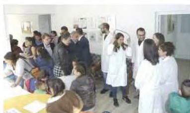
Από την εόρμηση στον οικισμό των Ρομά στη Νέα Σμύρνη