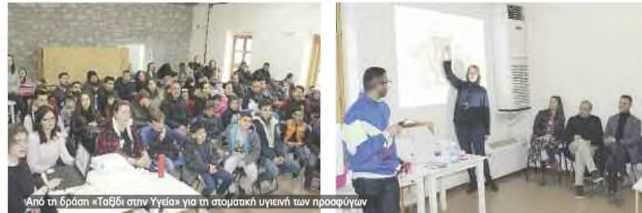
Από τη δράση «Ταξίδι στην Υγεία» για τη σεξουαλική υγιεινή των προσφύγων

προβέσεις της ομάδας είναι ο διαχωρισμός της δράσης σε δράσεις προγραμμάτων υγείας και δράσεις προληπτικές ιατρικής. Στην πρώτη κατηγορία προγραμματίζονται παρεμβάσεις για τις εξαρτησές από κάθε ουσία, το αλκοόλ και τη διατροφή, με ομιλίες στον γενικό πληθυσμό ενώ στη δεύτερη κατηγορία προγραμματίζονται στον παιδολογικό τομέα σεξουαλικές μετρήσεις στον γενικό πληθυσμό για έλεγχο του μεταβολικού συνδρόμου και συστηματικότερη εφαρμογή του ανταγωνιστικού εμβολιασμού. Στον παιδολογικό τομέα προγραμματίζονται δράσεις σε ουσία για σεξουαλικώς βλάπτος, υγιος κ.λ.π.), και έλεγχος για δυσχρωματώση και σπονδυλικές στήλεις σε συνεργασία με άλλες TOMY σε μαθητές της Σης Δημοτικού σε όλα τα σχολεία. Αιχλήθηκε δράσεις αναμένεται να αναληφθούν στα Γυμνάσια της πόλης για να σεξουαλικώς μεταδιδόμενα νοσήματα με έμφαση στον HPV και τα κονδυλώματα με εργασματολογία στους μαθητές και ομιλίες στους γονείς, ενώ θα συνεχιστούν και οι επισκέψεις στους Ρομά της Νέας Σμύρνης.