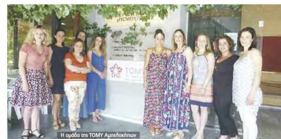
Η ομάδα της TOMY Αμπελοκήπων

ΟΙ ΕΠΙΔΟΣΕΙΣ ΣΕ ΑΡΘΗΜΩΣ Η TOMY Αμπελοκήπων Λάρισας σχετίζεται από μια γενικότατο, μια παιδολογία, μια παιδίατρο, δύο νοσηλεύτριες, δύο επισκέπτριες υγείας, μια κοινωνική λειτουργό και δύο διακπικούς υπαλλήλους.