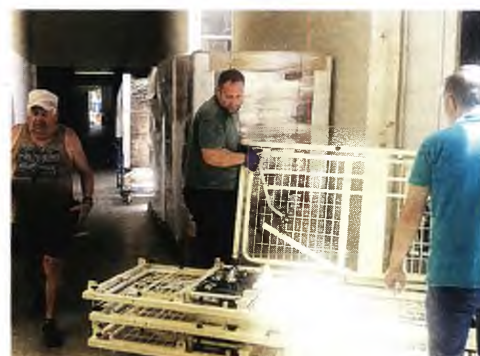
Μεταξύ άλλων πρόσφεραν 21 κρεβάτια για τις ΤΟΜΥ (Τοπικές Μονάδες Υγείας) και Κέντρα Υγείας της περιοχής

Κ αράβανι βοήθειας με υγειονομικό υλικό και εξοπλισμό τελευταίας τεχνολογίας έφτασε χθες στην Πάτρα με αποστολέα φιλέλληνες της Γαλλίας.