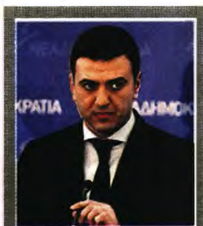
Προτεραιότητα του υπουργού η στήριξη των καρκινοπαθών

Αξίζει να σημειωθεί ότι βασικός άξονας της κυβέρνησης είναι η συνεργασία με τον ιδιωτικό τομέα χωρίς την επιβάρυνση των πολιτών. Αυτό που οραματίζεται και θεωρεί ότι θα φέρει πιο αποτελεσματικές υπηρεσίες δημόσιας υγείας για τους Έλληνες είναι η ανολοκωτισμένη από τον ιδιωτικό