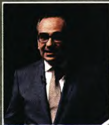
Πάνω: Ο νέος υπουργός Υγείας Βασίλης Κικίλιας. Κάτω: Ο υφυπουργός Βασίλης Κοντοζαμάνης.

τομέα, ιδιαίτερα στον τομέα των διαγνωστικών εξετάσεων στα δημόσια νοσοκομεία, καθώς είναι γνωστό πως τα μηχανήματα είτε είναι λίγα είτε υπολειπόμενα.