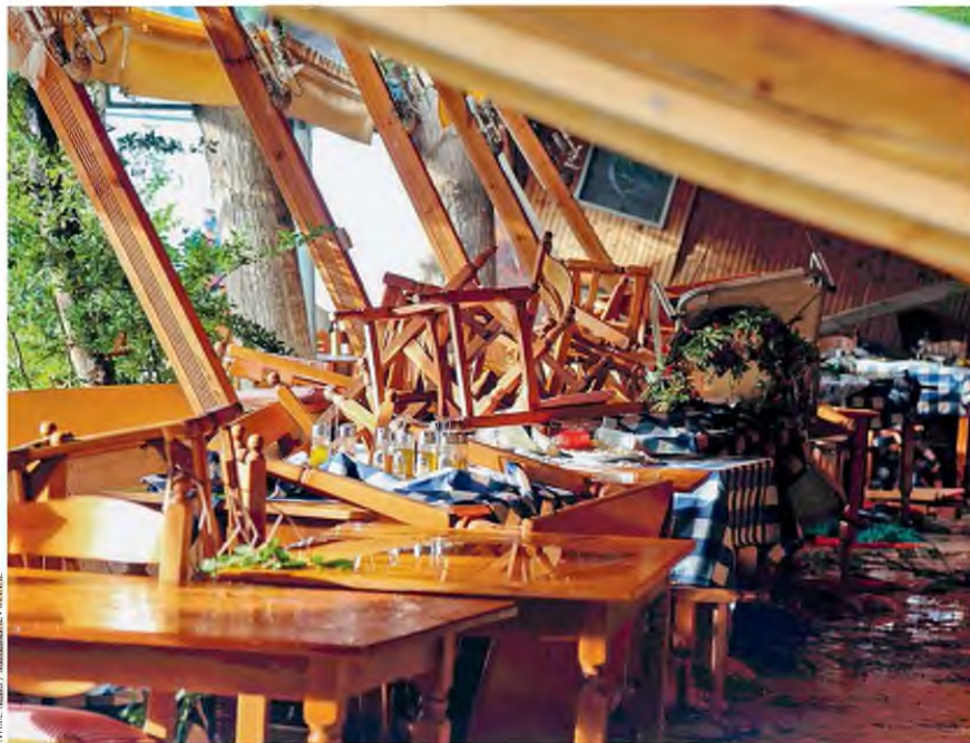
INTDUE NEWS / ANTOINIARE FIANCHE

Επτά νεκρούς , 120 τραυματίες, εκ των οποίων οι 26 σοβαρότερα, σημαντικές υλικές ζημιές και προβλήματα στην ηλεκτροδότηση προκάλεσε στη Χαλκιδική η «υπερκυτταρική καταιγίδα» όπως ονομάζεται, που μεταφέρει σύννεφα που παράγουν πολύ ισχυρές βροχές, καλάζι και ενίοτε ανεμοστρόβιλους.