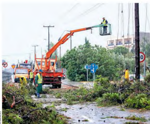
Άμεσα ξεκίνησαν, χθες, οι εργασίες αποκατάστασης.

Λίγο μετά τη μία τα ζητήματα της Πέμπτης, κυβερνητικές πηγές ενημέρωναν ότι κηρύχθηκε σε κατάσταση έκτακτης ανάγκης η ευρύτερη περιοχή της Χαλκιδικής και ότι με εντολή του πρωθυπουργού μετέβαινε κυβερνητικό κλιμάκιο, το οποίο θα