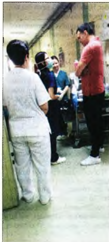
Ο Β. Κικίλιας συζητά με το νοσηλευτικό προσωπικό

Σημειώνεται ότι την περασμένη Παρασκευή το βράδυ ο Βασίλης Κικίλιας επισκέφτηκε αιφνιδιαστικά κατά τη διάρκεια