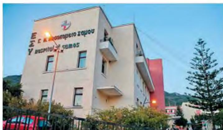
Το Γενικό Νοσοκομείο Σάμου λειτουργεί χωρίς παιδίατρο, λόγω... άδειας.

Ειδικότερα, το νοσοκομείο Σάμου είχε μείνει με μία παιδίατρο εδώ και οκτώ μήνες. Η παιδίατρος έλαβε άδεια από την περασμένη Παρασκευή για σοβαρούς οικογενειακούς λόγους, με αποτέλεσμα το νοσοκομείο να μην έχει –αυτή την εβδομάδα– παιδιατρική κάλυψη. Αρχικά, είχε αποφασιστεί από τον υπουργό Υγείας Βασίλη Κικιλία η μετακίνηση στο νοσοκομείο του διευθυντή Παιδιατρικής του Κέντρου Υγείας Καρλοβασιού Σάμου . Η μετακίνηση ήταν διάρκειας τεσσάρων ημερών (από προχθές έως και αύριο), ωστόσο