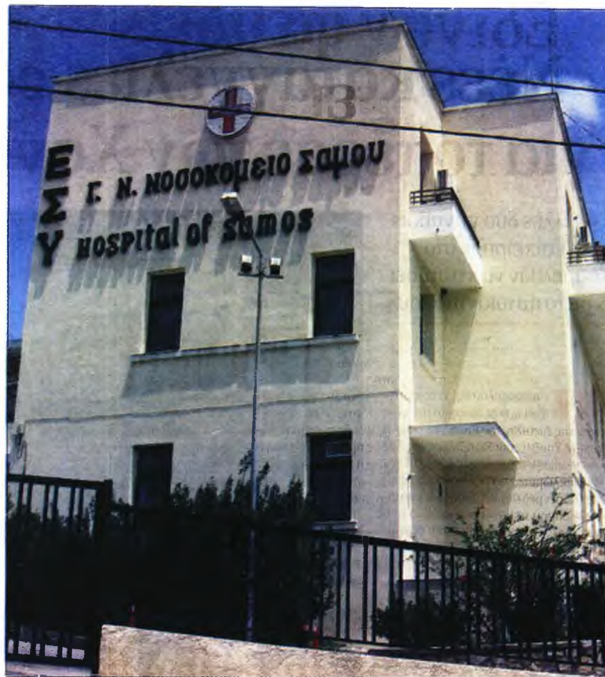
Το Νοσοκομείο Σάμου, στο οποίο η Παιδιατρική Κλινική έκλεισε πριν από λίγες μέρες γιατί η μοναδική παιδίατρος, που εδώ και οκτώ μήνες εργάζεται χωρίς ρεπό, πήρε την άδειά της