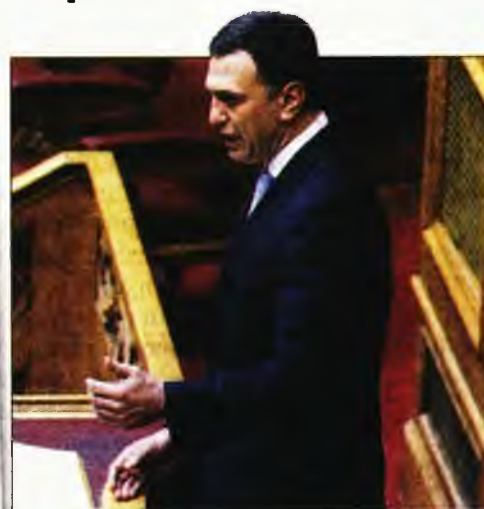
Ο υπουργός Υγείας Βασίλης Κικίλιας και το χθεινό πρωτοσέλιδο της «κυριακάτικης δημοκρατίας»

Με ύψιστη προτεραιότητα την ενίσχυση της πρόληψης και τον περιορισμό των ουρών της ντροπής, το νέο σχέδιο, με σύνθημα «καλύτερη δημόσια υγεία για τον άνθρωπο», περιλαμβάνει δωρεάν προληπτικές εξετάσεις για όλους σε κρατικές και ιδιωτικές δομές, με επιπλέον στήριξη της φροντίδας για ευάλωτες κοινωνικές ομάδες. Ειδικότερα για τις πιο ευάλωτες κοινωνικές ομάδες ο σχεδιασμός περιλαμβάνει την εξασφάλιση ραντεβού με τους γιατρούς εντός 24ώρου και τη διανομή φαρμάκων για τους βαρέως πάσχοντες στο σπίτι. Ιδιαίτερη βαρύτητα δίνεται στην ανακούφιση των καρκινοπαθών και στον περιορισμό της ταλαιπωρίας που τώρα υφίστανται.