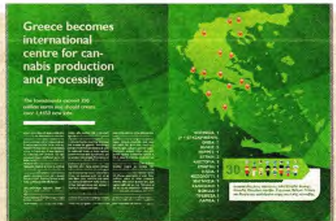
Δείγμα από το πρώτο περιοδικό για την κάνναβη στην Ελλάδα το οποίο θα κυκλοφορήσει σύντομα

Έχει γίνει μόνο η αρχή. Χρειάζονται αρκετές υπουργικές αποφάσεις ώστε να αποσαφηνιστεί το νομικό πλαίσιο. Αυτή τη στιγμή είναι εκατοντάδες οι Έλληνες επαγγελματίες, καλλιεργητές, μεταποιητές και πωλητές της βιομηχανικής-κλωστικής κάνναβης που αιτούνται την ύπαρξη σαφών κανόνων ώστε να μπορούν να εργαστούν με ευπρέπεια. Είναι επίσης δεκάδες οι ξένοι επενδυτές στον τομέα της λεγόμενης «φαρμακευτικής κάνναβης» που αναμένουν αποσαφήνιση του νομικού πλαισίου ώστε να φτάσουν μέχρι την καλλιέργεια και την παραγωγή «φαρμάκων κάνναβης». Αν παραμείνουμε αδρανείς, θα χάσει η χώρα το διακριτικό της πλεονέκτημα. Χρειάζεται ταχύτητα και ευφυΐα από την κάθε κυβέρνηση. Για τους ασθενείς, που ακόμη δεν έχουν πάρει φάρμακο κάνναβης ενώ οι σχετικές εξαγγελίες έχουν κλείσει διетία, ας μη μιλήσουμε καν. Συνεχίζουν να τραβάνε τον δικό τους Γολγοθά.