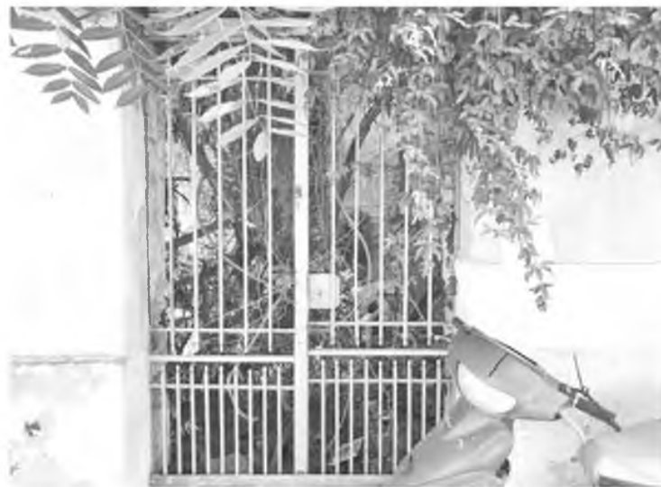
Φίδια, ποντίκια, σαμιαμίδια και τοξικομανείς βρίσκουν καταφύγιο στον χώρο

Υπάρχουν και αυτοί που δεν προχώρησαν στην αποδοχή κληρονομιάς από τον συγγενή τους, η εμφανίζονται πάνω