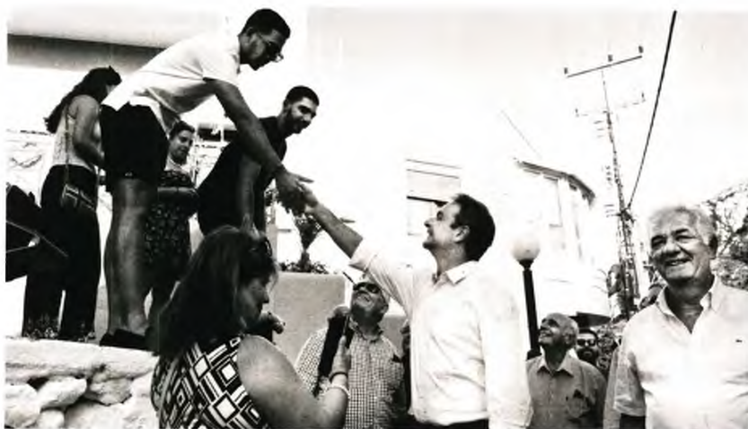
ΓΡΗΓΟΡΟΥ ΠΡΩΘΥΠΟΥΡΓΟΥ ΔΗΜ. ΠΑΠΑΡΗΤΣΟΥ