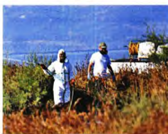
Σε 12 δήμους της χώρας έχουν καταγραφεί τις τελευταίες τέσσερις εβδομάδες τουλάχιστον 25 περιστατικά της λοίμωξης του ιού του Δυτικού Νείλου