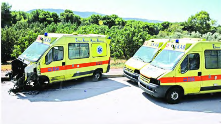
Αν και δεν έχει γίνει επίσημη καταγγελία, αρκετοί αναφέρουν ότι επιπλέον ξηλώνουν εξαρτήματα από τα ασθενοφόρα λόγω έλλειψης φρούλας του χώρου

«Η υποχρηματοδότηση του φορέα έχει ως αποτέλεσμα να μην υπάρχουν αρκετά κονδύλια για τη συντήρηση των οχημάτων», εξηγεί ο πρόεδρος των εργαζομένων του ΕΚΑΒ, Γιώργος Μαθιόπουλος. «Είναι χαρακτηριστικό ότι τον Ιούνιο δεν είχε υπογραφεί η έκτακτη επι-