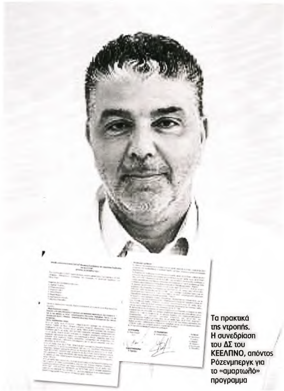
Τα πρακτικά της ντροπής. Η συνεδρίαση του ΔΣ του ΚΕΕΛΠΝΟ, από τον Ρόζενμπεργκ για το «αμαρτωλό» πρόγραμμα

Εισαγγελική έρευνα μετά τις καταγγελίες για το μεγάλο «πάρτι» στο προσφυγικό