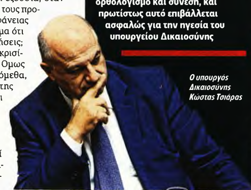
Ο υπουργός Δικαιοσύνης Κώστας Λαππάς

Η Δικαιοσύνη επιβάλλει σε όλους όσοι άμεσα ή έμμεσα έχουν σχέση με τον θεσμό της να επιδεικνύουν σοβαρότητα, υπευθυνότητα, ορθολογισμό και σύνεση, και πρωτίτως αυτό επιβάλλεται ασφαλώς για την ηγεσία του υπουργείου Δικαιοσύνης