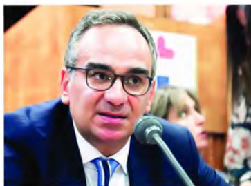
Ο υφυπουργός Υγείας, Βασίλης Κοντοζαμάνης.

Χώρας μας, είναι ότι αυτές αναμένεται να είναι τέτοιες έκτασης, ώστε να δίδεται με σαφήνεια το «στίγμα» της αλλαγής στην πολιτική διεύθυνση του δημόσιου συστήματος Υγείας. Σύμφωνα με πολύ καλά πληροφορημένες πηγές των «Π», τις αλλαγές προσώπων στις κορυφές των διοικήσεων των επτά Υ.Π.Ε. θα ακολουθήσουν οι τοποθετήσεις νέων επικεφαλής και νέων μελών Δ.Σ. στους εποπτευόμενους από το υπουργείο Υγείας φορείς και Οργανισμούς, όπως στον Εθνικό Οργανισμό Φαρμάκων (ΕΟΦ), στον Οργανισμό Κατά των Ναρκωτικών (ΟΚΑΝΑ), στον Εθνικό Οργανισμό Δημόσιας Υγείας (ΕΟΔΥ), στο Εθνικό Κέντρο Αμεσης Βοήθειας (ΕΚΑΒ), στο Ινστιτούτο Φαρμακευτικής Έρευνας και Τεχνολογίας (ΙΦΕΤ), στο Ινστιτούτο «Παστέρ», στο Εθνικό Κέντρο Αιμοδοσίας (ΕΚΕΑ), στο Γνώσιο Καρδιοχειρουργικό Κέντρο (ΝΙΚΚ) κ.α. Εκτιμάται βεβαίως ότι όλοι οι επικεφαλής και τα μέλη Δ.Σ. των εποπτευόμενων από το υπουργείο Υγείας φορέων και οργανισμών θα αντικατασταθούν, δεδομένου ότι σχεδόν όλοι έχουν υποβάλει τις παρατήσεις τους στον Βασίλη Κικιλία και παραμένουν στις θέσεις τους μόνο μέχρι την τοποθέτηση των διαδόχων τους. Ερωτήματα παραμένουν αποκλειστικά και μόνο για τις περιπτώσεις