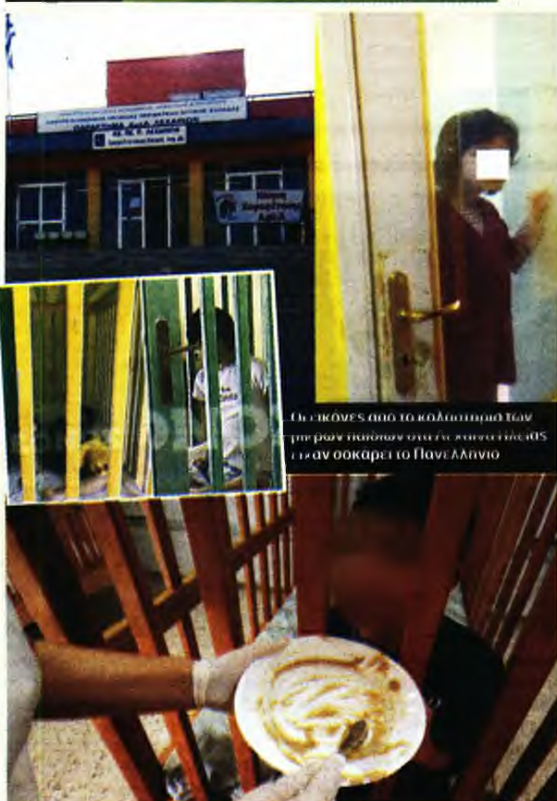
Οι σκόνης από το κλουβιού των τυφλών παιδιών είναι επικίνδυνη και αν οσκαρεί το Πανελλανίο

“ Η Ανδριάνα ήταν από τα τελευταία άτομα που απελευθερώθηκαν από τη ζωή στο κλουβί ”