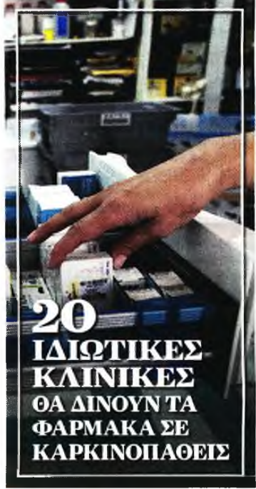
▶ ΣΕΛΙΔΕΣ 14-15

▶▶ ΥΠ. ΥΓΕΙΑΣ: ΞΕΚΙΝΑ ΑΠΟ 20 ΙΔΙΩΤΙΚΕΣ ΚΛΙΝΙΚΕΣ ΣΤΗΝ