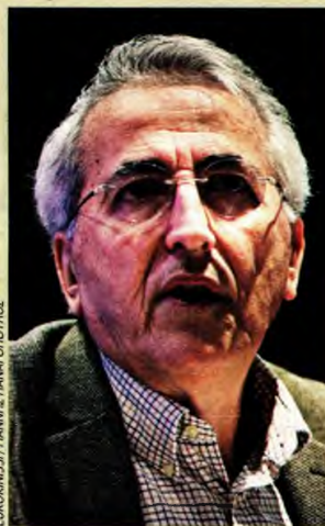
Γ. Παναγόπουλος, ο πρόεδρος της ΓΣΕΕ

«Η ΓΣΕΕ δεν είναι στην καλύτερη φάση», «το ΚΚΕ χρησιμοποιεί ακροδεξιές πρακτικές» και «τα χειρότερα τα είδαμε από κυβερνήσεις που στα λόγια ήταν αριστερές...»! Πυροβολισμούς προς διάφορες κατευθύνσεις εξαπέλυσε ο πρόεδρος της προσωρινής, διορισμένης διοίκησης της Συνομοσπονδίας, Γιάννης Παναγόπουλος, σε συνέντευξη Τύπου ενόψει του συλλαλητηρίου του Σαββάτου, κρατώντας τα καλά λόγια για τη νέα κυβέρνηση: «Η θεσμική κανονικότητα αποκαταστάθηκε με τη συνάντηση των εκπροσώπων των συνδικαλιστικών οργανώσεων με τον πρωθυπουργό, μια κανονικότητα που είχε διαταραχθεί στα τέσσερα χρόνια του ΣΥΡΙΖΑ στην εξουσία».