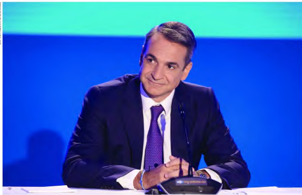
Ο πρωθυπουργός Κυριάκος Μητσοτάκης, χθες, κατά την καθιερωμένη συνέντευξη Τύπου στο πλαίσιο της 84ης ΔΕΘ.

«Θέλουμε τα ελληνικά ομόλογα να επιστρέψουν στην επενδυτική βαθμίδα, ώστε να δανειζόμαστε ακόμη φθηνότερα. Θα αποπληρώσουμε τα δάνεια του ΔΝΤ. Το αίτημα θα κατατεθεί στο Eurogroup της Παρασκευής», δήλωσε ο κ. Μητσοτάκης για τα δάνεια