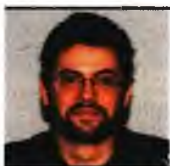
Επιμέλεια: ΓΙΩΡΓΟΣ ΚΑΛΛΙΝΗΣ

Η επιστήμη έχει ασχοληθεί με τον τρόπο με τον οποίο η επιμήκυνση του προσδόκιμου ζωής μπορεί να καταστεί δυνατή. Σήμερα για πρώτη φορά το ενδιαφέρον επικεντρώνεται στη δημιουργία ενός χαπιού που θα αναστρέφει τη φυσιολογική διαδικασία γήρανσης και τα προβλήματα που συνδέονται με αυ-