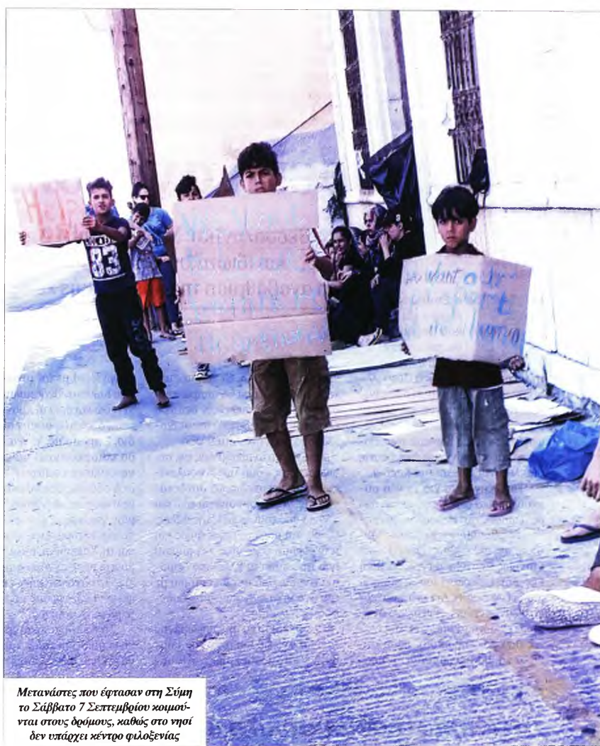
Μετανάστες που έφτασαν στη Σάμη το Σάββατο 7 Σεπτεμβρίου κοιμούνται στους δρόμους, καθώς στο νησί δεν υπάρχει κέντρο φιλοξενίας

Η τιμή, πάντως, άλλαζε αν η περίπτωση χαρακτηριζόταν πιο εύκολη ή πιο δύσκολη. Οι... κανόνες που ακολουθούσε το κύκλωμα έγιναν πιο αυστηροί όταν ενημερώθηκαν για την παρουσία της Αντιτρομοκρατικής στο κέντρο ταυτοποίησης.