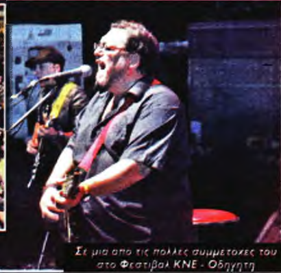
Σε μια από τις πολλές συμμετοχές του στο Φεστιβάλ ΚΝΕ - Οδηγητή

«Μας αφήνει για συντροφιά τον πλούτο της δημιουργίας του»