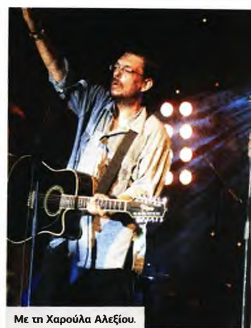
Με τη Χαρούλα Αλεξίου.