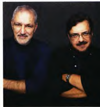
Με τον φεινό συνοδοιπόρο του Νίκο Πορτοκαλόγλου

ροπήσει. Είναι ικανός να σε κρατήσει σε εγρήγορση και να σου δημιουργήσει την αίσθηση ότι αξίζει να ζεις και να το παλεύεις. Ασε που αν σε έναν δίσκο ακούς μόνο τραγούδια “διαμαρτυρίας”, τότε είναι βέβαιο ότι θα καταλήξεις στον ψυχίατρο. Και στα άλμπουμ ο έρωτας λειτουργεί σαν γιατρικό». Και για τις ξαφνικές, άδικες απώλειες σαν αυτήν που μας επιφύλαξες χθες, πού να βρούμε γιατρικό, Λαυρέντη;