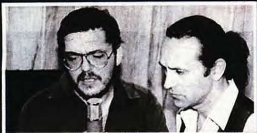
Την περίοδο των μεγάλων επιτυχιών, με τον Γιώργο Νταλάρα