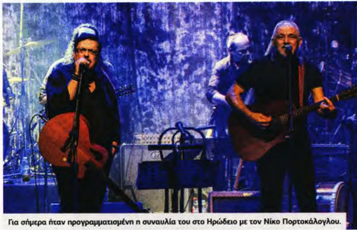
Για σήμερα ήταν προγραμματισμένη η συναυλία του στο Ηρώδειο με τον Νίκο Πορτοκαλόγλου.