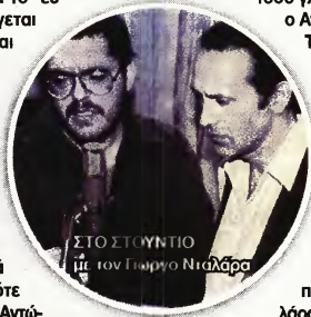
ΣΤΟ ΣΤΟΥΔΙΟ με τον Πιώργο Νταλάρα

ματα αυτά που κάνεις για τα μαγαζά που παίζω εγώ» μου είπε. Ήταν τόσο γλυκός άνθρωπος ο Αντώνης» είχε πει. Το «Διδυμότειχο μπλουζ», το βιογραφικό τραγούδι από πν εμπειρία του στον Στρατό, προοριζόταν για τον Βασίλη Παπακωνσταντίνου, αλλά τελικά το είπε ο Πιώργος Νταλάρας. «Του χρωστάω ένα "ευχαριστώ"» ανέφερε πρόσφατα ο καλλιτέχνης.