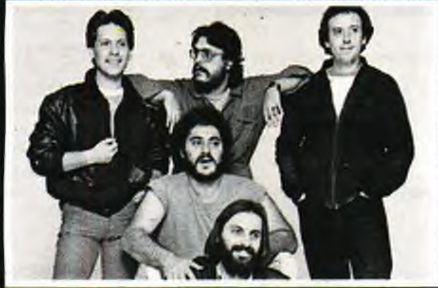
Το 1983, το συγκρότημα P.I.J., που είχε δημιουργήσει με τον Παύλο Κικριλή και τον Τάκη Βασαλάκη, μετονομάστηκε σε Τερμίτες