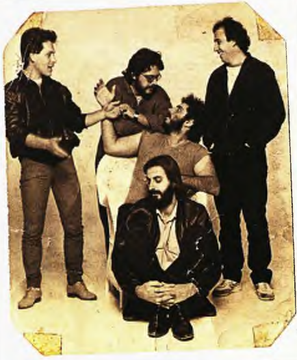
Με τους «Termites»

με τους «P.L.J. Band» το πρώτο του δίσκακι 45 στροφών με τίτλο «Gaspar» (1978) και αγγλικό στίχο. Λίγα χρόνια μετά κυκλοφορεί ο δεύτερος δίσκος τους και το συγκρότημα μετονομάζεται σε «Termites», που παραπέμπει ξεκάθαρα στους λατρεμένους του Beatles (σκαθάρια). Το 1984 κυκλοφορεί ο δίσκος «Αμαρτωλή Μαρία» με τη συμμετοχή του Γιώργου Νταλάρα, ενώ το 1986 δίνουν την αξεχαστη συναυλία στον Λυκαβηττό όπου εκτός από τον Νταλάρα συμμετέχουν ο Σάκης Μπουλάς και ο Άντωνης Βαρδής. Δύο χρόνια μετά με τον δίσκο «Περιμένοντας τη βροχή» οι «Termites» διαλύονται.