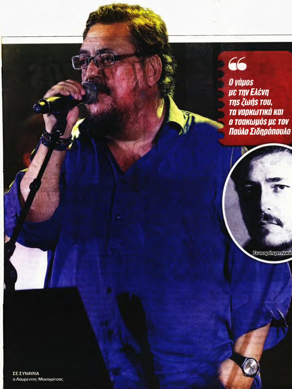
ΣΕ ΣΥΝΑΥΛΙΑ ο Λαυρέντης Μαχαιρίτσας