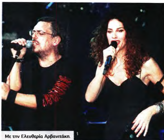
Με την Ελευθερία Αρβανιτάκη.