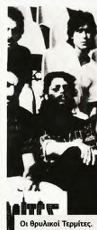
Οι θρυλικοί Τερμίτες.