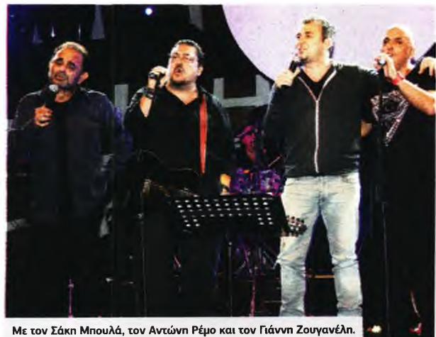
Με τον Σάκη Μπουλά, τον Αντώνη Ρέμο και τον Γιάννη Ζουγανέλη.