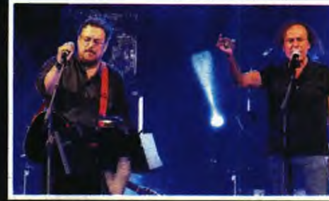
Σε συναυλία με τον Βασίλη Παπακωνσταντίνου