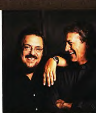
Με τον Γιώργο Νταλάρα ταυτίστηκε η σόφιο καριέρα του

Ήταν κοντά στα γενέθλια του η συνάντησή μας, η Ελλάδα βουτούσε βαθιά στην κρίση, κι εκείνος που στους ανθρώπους συγχωρούσε πάντα «τη μεγάλη αγάπη ή την απόγνωση» επέμενε πως ο έρωτας είναι το γιατρικό σε κάθε περίπτωση. «Νομίζω πως ακόμα κι ένας αποτυχημένος έρωτας είναι το μόνο πράγμα που μπορεί να σε ισορ-