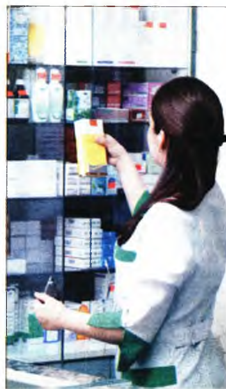
Φωτογραφία αρχείου από φαρμακείο. Αριστερά πάνω, ο υπουργός Υγείας Βασίλης Κικιλίας και, κάτω, ο πρόεδρος του Πανελληνίου Φαρμακευτικού Συλλόγου Κώστας Λουράντος

Ωστόσο, όπως είπαν κύκλοι του υπουργείου Υγείας στη «δημοκρατία», τα ΦΥΚ (58 ογκολογικά φάρμακα και σκευάσματα για τη σκλήρυνση κατά πλάκας συνολικά) θα τα αγοράζει ο ΕΟΠΥΥ και θα διανέμονται μέσα από τα φαρμακεία της γειτονιάς.