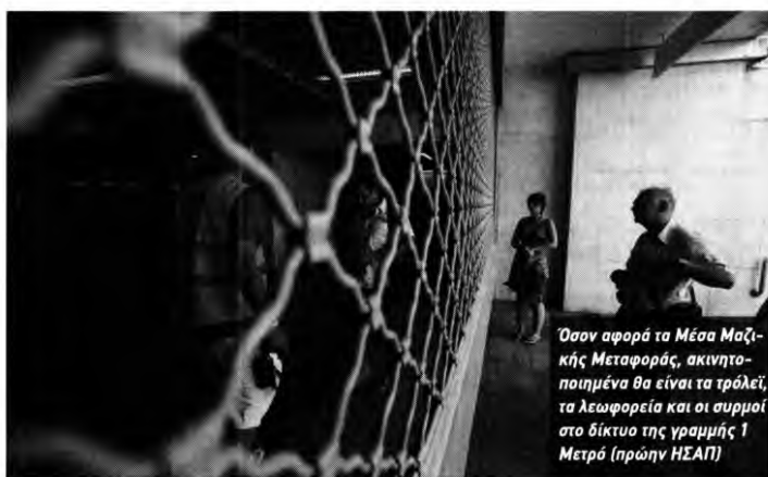
Όσον αφορά τα Μέσα Μαζικής Μεταφοράς, ακινητοποιημένα θα είναι τα τρόλεϊ, τα λεωφορεία και οι συρμοί στο δίκτυο της γραμμής 1 Μετρό (πρώην ΗΣΑΠ)

Το Διοικητικό Συμβούλιο της Πανελληνίας Ναυτικής Ομοσπονδίας (ΠΝΟ) αποφάσισε την πραγματοποίηση 24ωρης πανελλαδικής απεργίας στα πληρώματα σε όλες τις κατηγορίες πλοίων σήμερα, με αφορμή το αναπτυξιακό νομοσχέδιο που συζητείται στη Βουλή. Απεργία: «Παραλύει» η χώρα την Τρίτη (24/9) - Πώς θα κινηθούν τα ΜΜΜ - 2. Την ίδια στιγμή, προβλήματα θα υπάρξουν και στις ακτοπολικές συγκοινωνίες, καθώς δεμένα θα μείνουν τα πλοία στα λιμάνια. Έτσι, τα πλοία θα παραμένουν δεμένα από τις 6 το