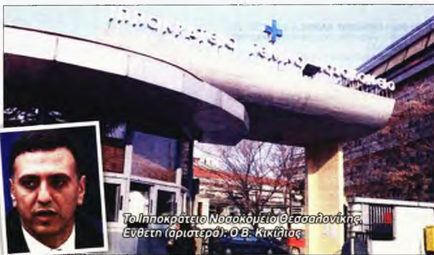
Το Ιπποκράτειο Νοσοκομείο Θεσσαλονίκης. Ενθετη (αριστερά): Ο Β. Κικίλιας

Ο ίδιος με επιστολή που απέστειλε στον υφυπουργό Υγείας Βασίλειο Κοντοζαμάνη ζητούσε την άμεση επιστροφή στο τμήμα ενός βιοπαθολόγου με μεγάλη εμπειρία στην ιστοσυμβατό-