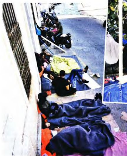
Πρόσφυγες και μετανάστες κοιμούνται στον δρόμο στη Σύμη. Πρόκειται για τον μοναδικό δρόμο που συνδέει τους δύο οικισμούς και το νέο λιμάνι του νησιού και περνούν καθημερινά φορτηγά, λεωφορεία κτλ