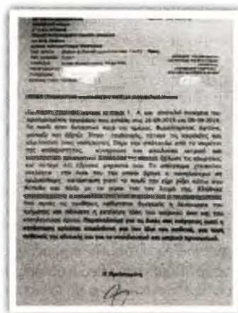
Η αναφορά της νοσηλευτικής υπηρεσίας για την επιθετικότητα του ανηλίκου

Χαρακτηριστικό είναι το έγγραφο της νοσηλευτικής υπηρεσίας του θεραπευτηρίου προς τη διοίκηση του νοσοκομείου, την κοινωνική υπηρεσία και την Παιδοψυχιατρική Κλινική: «Το παιδί ήταν διεγερτικό, έβριζε, έφτυνε, πέταγε καρέκλες στους νοσηλευτές. Χτύπαγε τις πόρτες, ξήλωσε τις κουρτίνες. Το απόγευμα χτυπούσε ανελέπτα τη θεία του, την οποία βρήκε η νοσηλεύτρια σε ημιλιπόθυμη κατάσταση, γιατί την είχε ρίξει κάτω στο πάτωμα και πίεζε με τα χέρια του τον λαιμό της. Κλήθηκαν η ασφάλεια και ο παιδοψυχίατρος. Παρακαλούμε για τις δικές σας ενέργειες, γιατί η κατάσταση κρίνεται επικίνδυνη για τον ασθενή, τους άλλους ασθενείς της κλινικής και το ιατρικό και νοσηλευτικό προσωπικό».