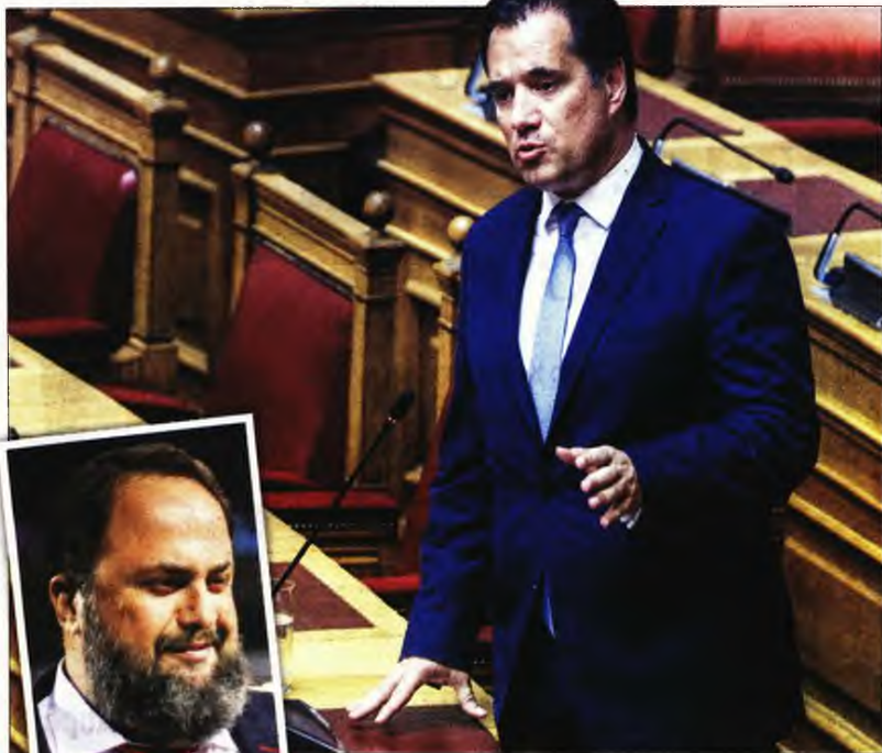
Ο υπουργός Ανάπτυξης Αδωνīs Γεωργιάδης στο βήμα της Βουλής. Κάτω αριστερά: Ο Βαγγέλης Μαρινάκης

Οι έλεγχοι των εταιριών που μπεινουν στα αναπτυξιακά προγράμματα, δηλαδή που παίρνουν χρήματα από τον κρατικό κορβανά, μεταφέρονται πλέον στις μεγάλες ιδιωτικές ελεγκτικές εταιρι-