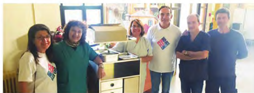
Μέλη της εθελοντικής ομάδας «People for Greece» έδωσαν ιατρικό υλικό στο Κέντρο Υγείας Αργαλαστής

Η ομάδα «People for Greece» έχει κατ' επανάληψη βοηθήσει την περιοχή, στηρίζοντας το Κοινωνικό παντοπωλείο και το Στέκι αλληλεγγύης για