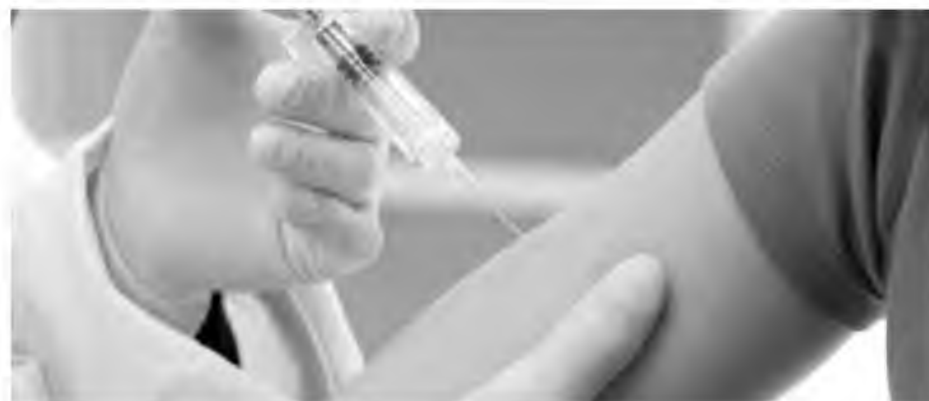
Πλήθος κόσμου σπεύδει να εμβολιαστεί κατά της γρίπης

Π ρόβλημα προκαλείται στη διάθεση αντιγριπικών εμβολίων προς τους ασφαλισμένους, καθώς εξαντλήθηκε η πρώτη παρτίδα, με τον Φαρμακευτικό Σύλλογο Μαγνησίας να υποβάλει αίτημα για παράταση ισχύος των συνταγών, κατ' αντιστοιχία με τον Πανελλήνιο Φαρμακευτικό Σύλλογο.