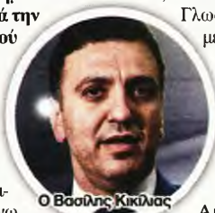
Ο Βασίλης Κικίλιας