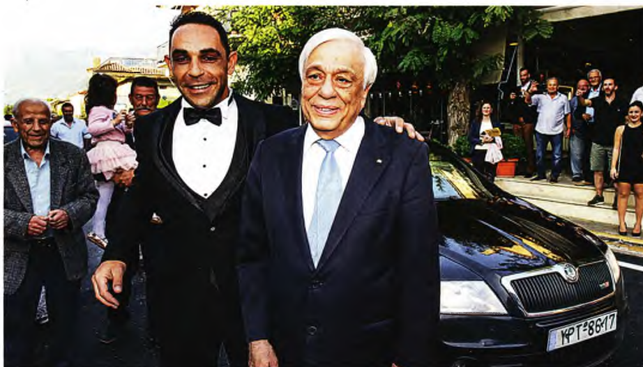
Οχι, δεν θέλω να φύγει

Η Νίκη Κεραμέως επανέφερε (και πολύ σωστά έκανε) το κριτήριο της αριστείας για τον σπαιοφόρο στις μαθητικές παρελάσεις. Δεν επιλέγουμε τους γνήτες μας στην τύχη, τους διαλέγουμε επειδή θεωρούμε ότι είναι καλύτεροι. Μπορεί να μην το πετυχαίνουμε πάντα, αλλά, τουλάχιστον στο σχολείο, υπάρχουν πιο αντικειμενικά κριτήρια. Προσωπικά η αισθητική των μαθητικών παρελάσεων με εννοκλεί, δεν μου αρέσει να βλέπω παιδιά να βαδίζουν σαν στρατιώτες - είμαστε η μοναδική ευρωπαϊκή χώρα που έχει αυτή την παράδοση και δεν γνωρίζω και πολλές παγκοσμίως. Ας είναι. Ας κάνουμε όμως και κάτι ακόμα. Από τη στιγμή που θέλουμε να επιδεικνύουμε εμπράκτως τη σύνδεση των νέων με την πατρίδα, ας προσθέσουμε στον εορτασμό των εθνικών επετείων την έννοια του εθελοντισμού. Ας κάνουν παρέλαση. Και μετά μία πράξη προσφοράς. Η πατρίδα δεν χρειάζεται, ευτυχώς, τη θυσία τους. Ας μάθουμε στα παιδιά να δίνουν, όμως, τη βοήθειά τους.