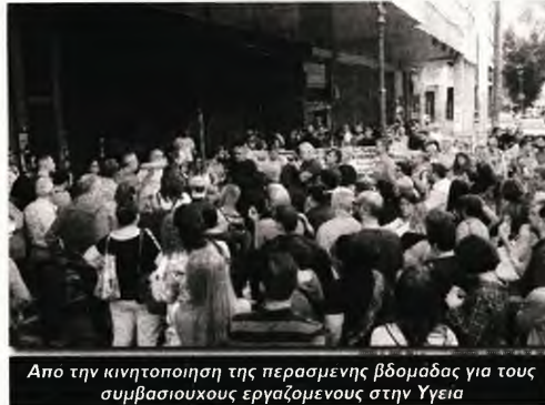
Απο την κινητοποίηση της περασμένης βδομάδας για τους συμβασιούχους εργαζομένους στην Υγεία

Γι' αυτό δεν προσλαμβάνουν το αναγκαίο μόνιμο προσωπικό και μειώνουν την κρατική χρηματοδότηση στις δημόσιες μονάδες Υγείας, ενώ αυξάνουν τις ασφαλιστικές εισφορές μας για υγειονομική περίθαλψη. Γι' αυτό προωθούν τη λειτουργία των δημόσιων νοσοκομείων με ιδιωτικοοικονομικά κριτήρια, ως "αυτοτελών επι-