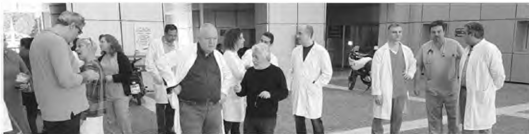
Παράσταση διαμαρτυρίας χθες το πρωί από γιατρούς στην είσοδο του Αχιλλοπουλείου

Ξεμένει... από γιατρούς το Αχιλλοπούλειο Νοσοκομείο Βόλου, με ό,τι αυτό συνεπάγεται στην ομαλή εξυπηρέτηση των ασθενών. Εως τέλος του μήνα τουλάχιστον τρία τμήματα θα κληθούν να λειτουργήσουν από ένα μόλις άτομο(!), καθώς λήγουν οι συμβάσεις των επικουρικών γιατρών. Πάντως, οι τραγικές ελλείψεις σε προσωπικό, που έρχονται να επιδεινωθούν με τη λήξη των συμβάσεων των επικουρικών, έχουν ήδη αντίκτυπο στη λειτουργία των χειρουργείων. Έχουν μείνει οι μισοί αναισθησιολόγοι και η λίστα αναμονής για τακτικό χειρουργείο ξεπερνά τους τέσσερις μήνες.