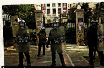
Από την αποστολή καταστολής με την τεταμένη κατάσταση επί των συγκεκριμένων μερών στην ΑΣΟΕΕ

Στο μεταξύ, χτες το πρωί, φοιτητές της σχολής, μέλη της ΚΝΕ, βρέθηκαν στην πύλη της ΑΣΟΕΕ στην οδό Πατησίων, μοιράζοντας την ανακοίνωσή με την οποία η Οργάνωση καταγγέλλει την