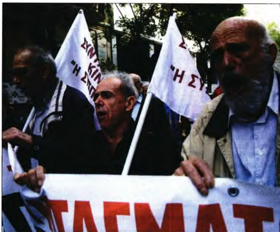
Πορεία διαμαρτυρίας συνταξιούχων στη Θεσσαλονίκη