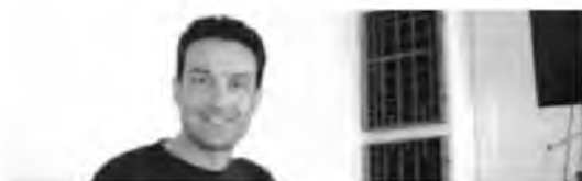
Του Γιώργου Λαμπράκη