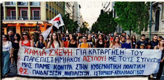
Από την κινητοποίηση εναντίον στην καταργήση του ασύλου του περασμένο Ιούλη

Την ώρα που εκτυλισσάταν το παραπάνω σκηνικό, το Γραφείο Τύπου του ΚΣ της ΚΝΕ εξέδωσε ανακοίνωση καταγγέλλοντας τη νέα προσπάθεια παραβίασης του ασύλου στην ΑΣΟΕΕ και περιμπεδίασης της παρέμβασης μελών της ΚΝΕ από τα ΜΑΤ. Όπως σημείωσε: