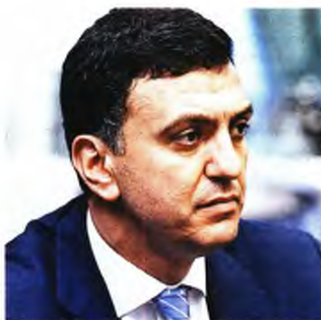
Ο υπουργός Υγείας Βασίλης Κικίλιας

Ειδικότερα και όπως προβλέπεται στην κρίσιμη τροπολογία «ως τιμή διαμόρφωσης του φαρμάκου θα ορίζεται ο μέσος όρος των δύο χαμηλότερων τιμών των κρατών-μελών