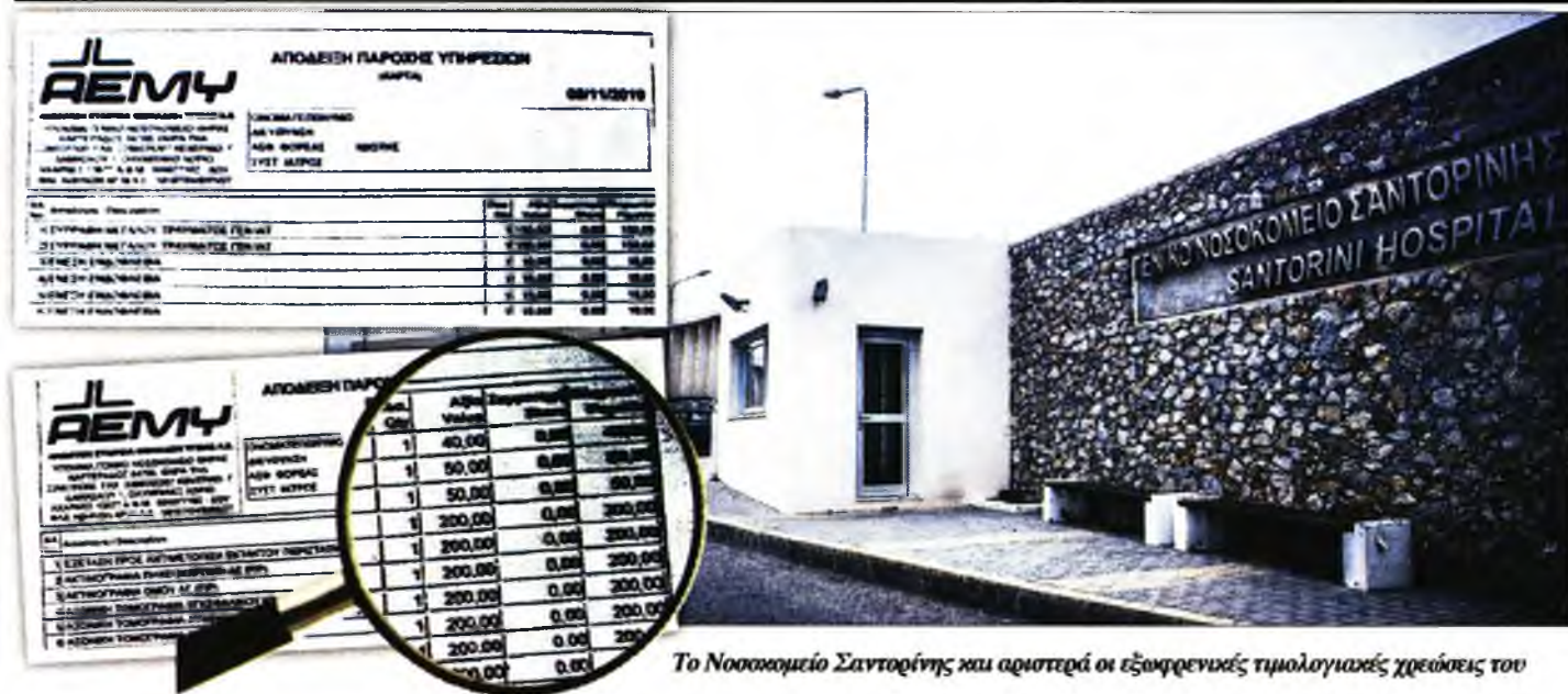
Το Νοσοκομείο Σαντορίνης και αριστερά οι εξοφρητικές τιμολογιακές χρεώσεις του

ΣΤΗΝ ΤΟΥΡΙΣΤΙΚΗ Σαντορίνη εφαρμόζονται τιμές... αστεράτου ξενοδοχείου στις νοσοκομειακές ιατρικές εξετάσεις.