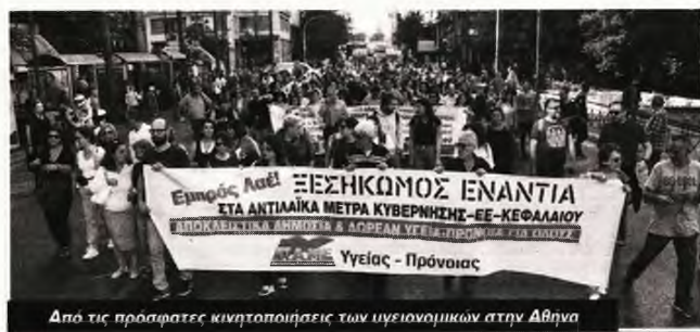
Δύο τις πρόσφατες κινητοποιήσεις των υγειονομικών στην Αθήνα

Στο μεταξύ, πάνω από το 20% των εργαζομένων στα δημόσια νοσοκομεία δουλεύει με το αίσχος των ελαστικών σχέσεων εργασίας , με συμβάσεις με ημερομηνία λήξης. Συνολικά, περίπου 16.000 άνθρωποι εργάζονται σε καθεστώς ομηρίας, κακοπληρωμένοι και απλήρωτοι, κάτω από τη δαμόκλειο σπάθι της απόλυσης: Πάνω α-