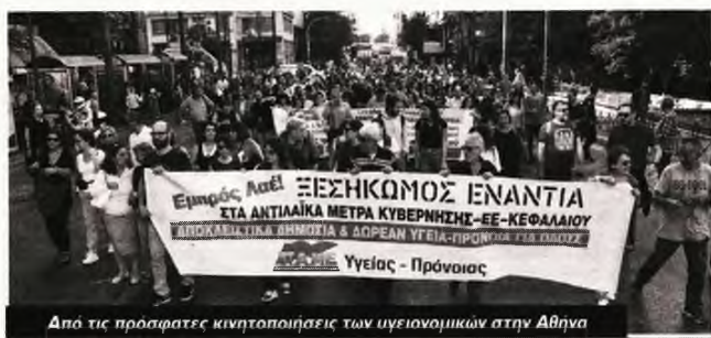
Από τις πρόσφατες κινητοποιήσεις των υγειονομικών στην Αθήνα

Στο μεταξύ, πάνω από το 20% των εργαζομένων στα δημόσια νοσοκομεία δουλεύει με το αίσχος των ελαστικών σχέσεων εργασίας, με συμβάσεις με ημερομηνία λήξης. Συνολικά, περίπου 16.000 άνθρωποι εργάζονται σε καθεστώς ομηρίας, κακοπληρωμένοι και απλήρωτοι, κάτω από τη δαμόκλειο σπάθη της απόλυσης: Πάνω α-