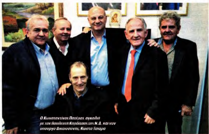
Ο Κωνσταντίνος Πατέρας αγκαλιά με τον βουλευτή Καρδίτσας της Ν.Δ. και νυν υπουργό Δικαιοσύνης, Κώστα Τσίρα