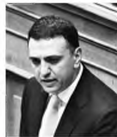
Ο υπ. Υγείας Βασίλης Κικιλίας έκανε χτες δεκτή την παραίτηση του σχεδόν 80χρονου διοικητή, η οποία, όπως προκύπτει από τις πληροφορίες, του ζητήθηκε κατόπιν κοινής απόφασης Μαξίμου και του αρμόδιου υπουργείου.

ΜΑΡΙΑ - ΝΙΚΗ ΓΕΩΡΓΑΝΤΑ mngeorgada@e-typos.com