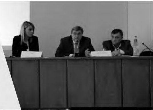
Στιγμιότυπα από την ημερίδα.

Ημερίδα ιατροδικαστικής στο Ασκληπιείο Βούλας για ιατρονομικά θέματα