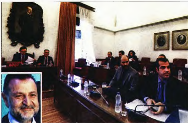
Ο βουλευτής της Ν.Δ. Θάνος Πλεύρης και ο βουλευτής του ΚΙΝ.ΑΛ. Βασίλης Κεγκέρογλου (ένθετη φωτο) έθεσαν προκλητικά ερωτήματα στη Μαρία Μαραγγέλη στην Προανακριτική Επιτροπή της Βουλής

Σε κάθε περίπτωση, όσα τεχνάσματα και να μετέλθουν τα δύο κόμματα, δεν μπορούν να καλύψουν το γεγονός ότι ενάμιση μήνα μετά τη συγκρότηση της επιτροπής ουδείς έχει αναφερθεί στη δίθεν εμπλοκή του Δημήτρη Παπαγγελόπουλου σε «σκευωρία» εις βάρος των δέκα.