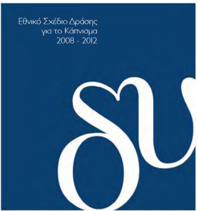
-Το Εθνικό Σχέδιο για το Κάπνισμα του 2008 - 90 σελίδες από 18μελή επιτροπή

Τ ην περασμένη εβδομάδα ("Χ.Ν." 19.11.2019) έγραφα για τη νέα Κοινή Υπουργική Απόφαση (ΚΥΑ) αναφορικά με την εφαρμογή του αντικαπνιστικού νόμου ότι «έχοντας ασχοληθεί τα τελευταία 2½ χρόνια με το θέμα, τοιμώ να πω ότι πρόκειται για ένα σαφώς βελτιωμένο κείμενο σε σχέση με την προηγούμενη απόφαση του 2010». Ωστόσο, με βάση λεπτομερέστερη ανάλυση της ΚΥΑ, σε συνδυασμό με τις εξαγγελίες του Πρωθυπουργού στις 20.11 για το Εθνικό Σχέδιο Δράσης κατά του Καπνίσματος, οφείλω να διατυπώσω μερικές σοβαρές επιφυλάξεις.