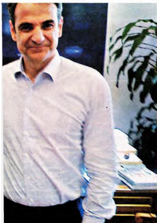
► Του ΔΗΜΗΤΡΗ ΤΕΡΖΗ

ΠΑΡΑ ΤΟ ΓΕΓΟΝΟΣ ότι η κυβέρνηση «παραίτησε» τον Κωνσταντίνο Πατέρα από τη διοίκηση του Νοσοκομείου Καρδίτσας και παρά τα όσα είπε περί «αστοχιών» ο υπουργός Επικρατείας κ. Γιώργος Γεραπετρίτης, από τον ρεπορτάζ προκύπτει ότι η επιλογή του 81 χρονου ήταν αφενός εν γνώσει του Μαξίμου, αφετέρου δεν αποτέλεσε προσωπική επιλογή του υπουργού Υγείας Βασίλη Κικίλια.