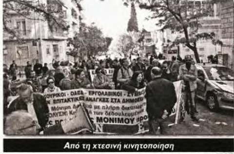
Από τη χτεσινή κινητοποίηση