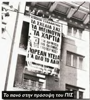
Το πανό στην πρόσοψη του ΠΙΣ

« Τ α νοσοκομεία δεν είναι επιχειρήσεις. Δώστε κρατικές επιχορηγήσεις» ήταν το μήνυμα της χτεσινής συγκέντρωσης των εργαζομένων στα δημόσια νοσοκομεία, που έγινε στο πλαίσιο της παναττικής στάσης εργασίας και της 24ωρης απεργίας στην υπόλοιπη Ελλάδα.