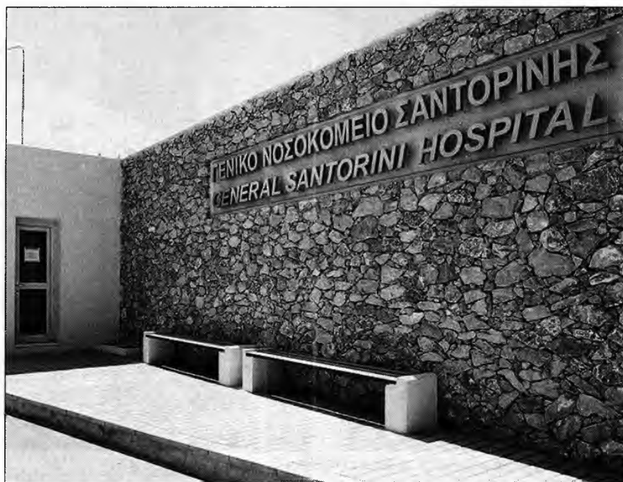
■ Τό Γενικό Νοσοκομείο Σαντορίνης