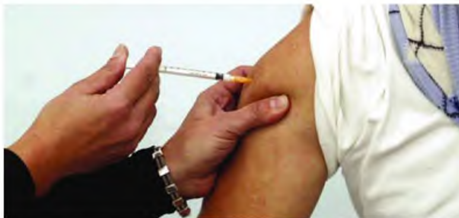
Όλα τα εμβόλια χορηγούνται δωρεάν από τα ασφαλιστικά Ταμεία

Σύμφωνα με τον Πρόεδρο του ΕΔΔΥΠΠΥ, Πρόεδρο του Ιατρικού Συλλόγου Αθηνών αλλά και Περιφερειάρχη Αττικής κ. Γιώργο Πατούλη «ο εμβολιασμός έναντι στην εποχική γρίπη, την πνευμονιοκοκκική πνευμονία και τον έρπητα ζωστήρα αποτελεί πράξη ευθύνης. Είναι γεγονός ότι στη χώρα μας διαθέτουμε σύγχρονα εμβολιαστικά προγράμματα και για τον ενήλικα και για τον