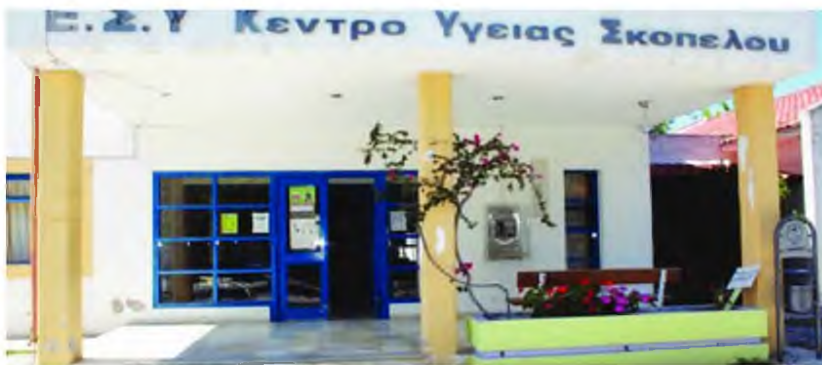
Προβλήματα στο Κέντρο Υγείας Σκοπέλου

Ο πρόεδρος του δημοτικού συμβουλίου περιέγραψε με μελανά