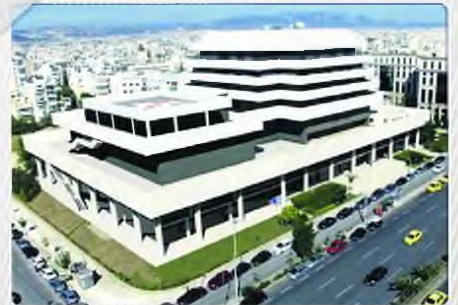
Το Ωνάσειο Εθνικό Μεταμοσχευτικό Κέντρο σε φωτοαπεικόνιση. Όπως φαίνεται στη φωτογραφία, το μεταμοσχευτικό κέντρο θα ανεγερθεί ακριβώς δίπλα στο Ωνάσειο Καρδιοχειρουργικό Κέντρο, στα αριστερά του.