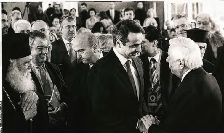
Η τελετή έναρξης των εργασιών του Κέντρου πραγματοποιήθηκε παρουσία του Προέδρου της Δημοκρατίας Προκόπη Παυλόπουλου, του Πρωθυπουργού Κυριάκου Μητσοτάκη και του Αρχιεπισκόπου Αθηνών και πάσης Ελλάδος Ιερώνυμου