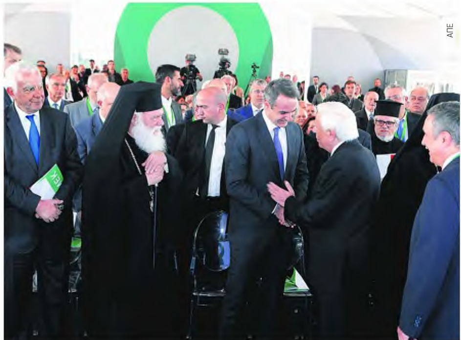
Ο Πρόεδρος της Δημοκρατίας, Προκόπης Παυλόπουλος, ο πρωθυπουργός Κυριάκος Μητσοτάκης και ο Αρχιεπίσκοπος Ιερώνυμος παρέστησαν στην εκδήλωση. Πάνω ο Πατριάρχης Αλεξανδρείας και Πάσης Αφρικής, Θεόδωρος Β', με τον πρόεδρο του Ίδρυματος Ωνάση, Αντώνη Παπαδημητρίου.

Ο νέος πρόεδρος του Εθνικού Οργανισμού Μεταμοσχεύσεων, Γιώργος Παπαθεοδωρίδης , εξέφρασε την ικανοποίησή του για το νέο Εθνικό Μεταμοσχευτικό Κέντρο , παράλληλα όμως και την απογοήτευσή του που η Ελλάδα υστερεί σε δωρεές οργάνων, καθώς όπως είπε: «Μεταμόσχευση χωρίς μοσχεύματα δεν υπάρχει». ■