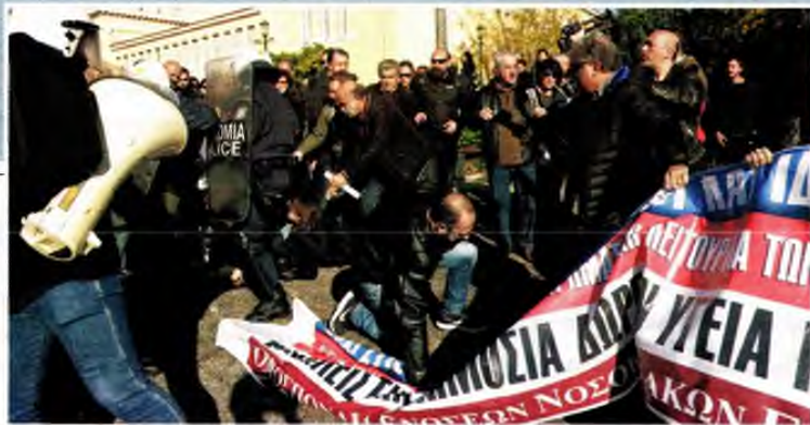
Από τη συγκέντρωση διαμαρτυρίας των εργαζομένων στα δημόσια νοσοκομεία και τις συμπλοκές με τα ΜΑΤ χθες στο Ζάππειο Μέγαρο