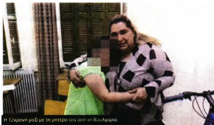
Η 12χρονη μαζί με τη μητέρα της από τη Βουλγαρία

ται να έχει υποστεί ακρωτηριασμό των κάτω άκρων του, κατά τη διάρκεια της δίωρης απολογίας του στην ανακρίτρια Γυθείου αρνήθηκε τις κατηγορίες που του αποδίδονται, ωστόσο του απαγορεύτηκε η έξοδος από τη χώρα.