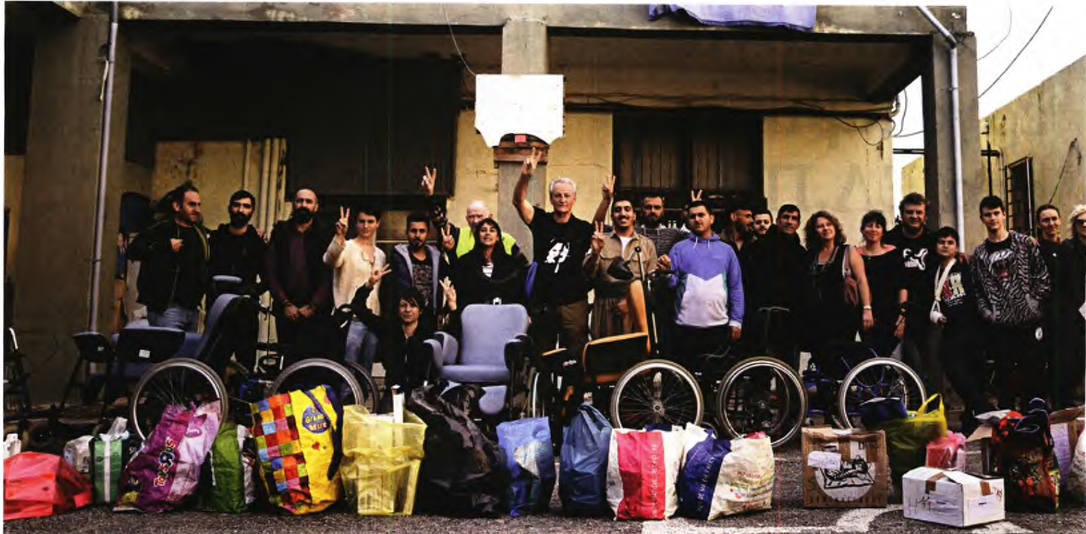
Μέρος της ανθρωπιστικής βοήθειας που συγκεντρώσαν οι Γάλλοι αλληλεγγύοι - αναπηρικά καροτσάκια, φάρμακα, βοηθήματα, νοσοκομειακά κρεβάτια- παραδόθηκε χθες στο Κέντρο Υγείας Λαυρίου, σε μια έμπρακτη χειρονομία ε

ΚΟΥΡΔΟΙ ΠΟΛΙΤΙΚΟΙ ΠΡΟΣΦΥΓΕΣ ΠΑΡΕΔΩΣΑΝ ΤΡΟΦΙΜΑ, ΦΑΡΜΑΚΑ, ΠΑΙΧΝΙΔΙΑ, ΡΟΥΧΑ ΚΑΙ ΥΓΕΙΟΝΟΜΙΚΟ ΥΛΙΚΟ ΣΤΟ