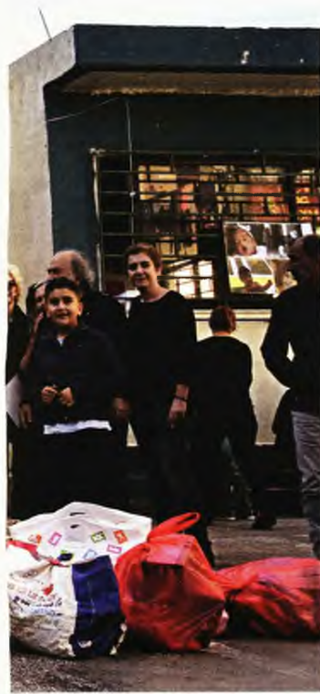
Ιγνωσμένων των Κούρδων στους Έλληνες