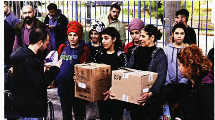
Οι Κούρδισσες γυναίκες και τα παιδιά, μέχρι και τα μικρά μωρά, συμμετείχαν στην πορεία ως το Κέντρο Υγείας Λαυρίου, κουβαλώντας στα χέρια και παραδίδοντας μέρος της υγειονομικής βοήθειας που συγκέντρωσαν οι Γάλλοι αλληλέγγυοι