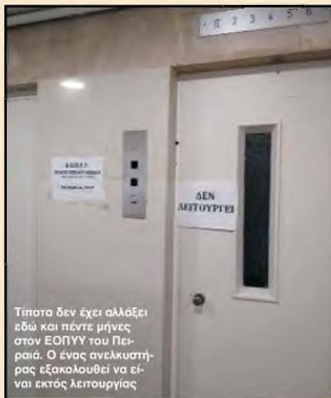
Τίποτα δεν έχει αλλάξει εδώ και πέντε μήνες στον ΕΟΠΥΥ του Πειραιά. Ο ένας ανελκυστήρας εξακολουθεί να είναι εκτός λειτουργίας

Ένταση και διαξιφισμοί μεταξύ των ασφαλισμένων ΕΟΠΥΥ: Πέντε μήνες χαλασμένος ο ανελκυστήρας