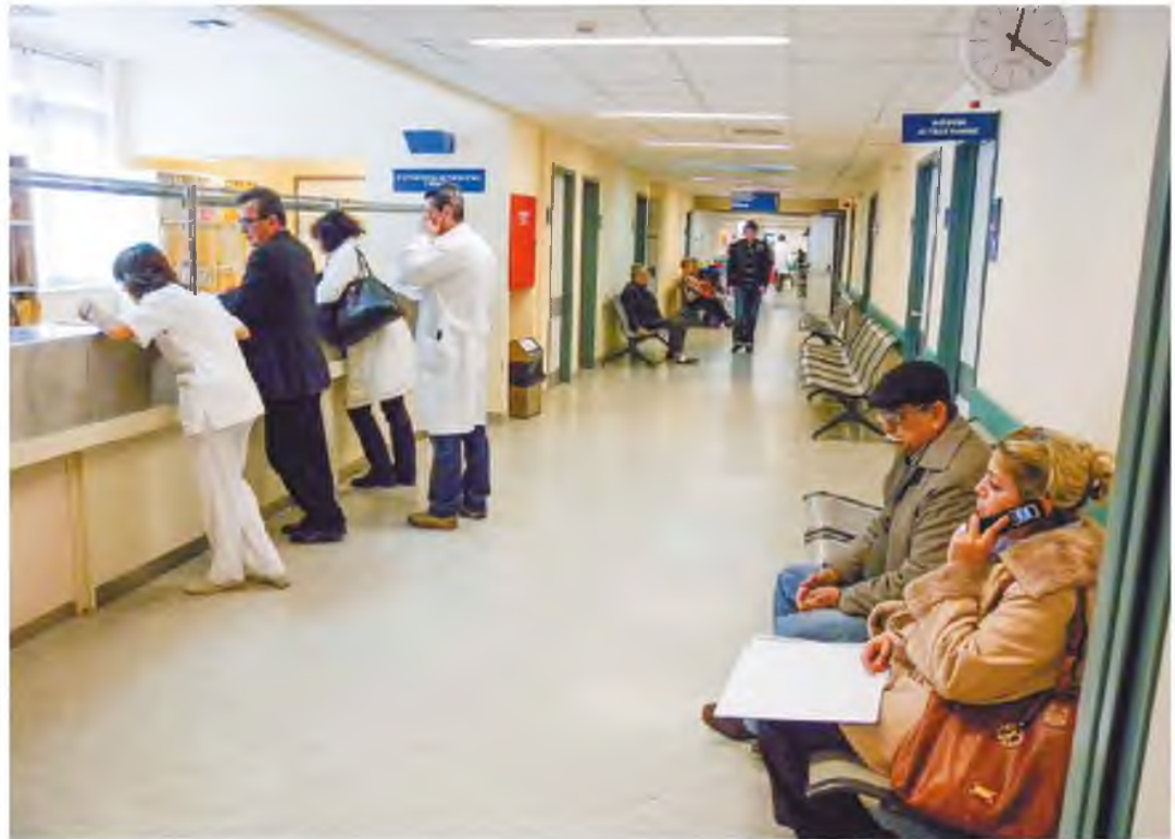
Τα τρία βασικά σημεία στα οποία θα αξιολογηθούν οι διοικητές σε πρώτη φάση αφορούν τη μείωση του χρόνου αναμονής στα Επείγοντα, τη σωστή λειτουργία των λογιστηρίων των νοσοκομείων και την ηλεκτρονική διακυβέρνηση.

Εκτός από τις έξι αλλαγές που έγιναν λόγω παραιτήσεων –μεταξύ των οποίων και η έπειτα από «προτροπή» του υπουργείου παραιτήση του 80χρονου Κωνσταντίνου Πατέρα–, ανακλήθηκε και η εντολή διορισμού επτά διοικητών και αναπληρωτών διοικητών, στη θέση των οποίων επιλέχθηκαν νέοι πάλι με βάση τις εισηγήσεις της επιτροπής. Στελέχη του υπουργείου Υγείας ανέφεραν στην «Κ» ότι δεν τέθηκε θέμα παρατυπιών στα δικαιολογητικά που κατατέθηκαν για κανέναν από τους νέους διοικητές και ότι οι αλλαγές αφορούσαν την επιλογή των καλύτερων, από άποψη προσόντων, «φιναλίστ». Από το υπουργείο Υγείας επισημαίνεται ότι το 77% των διοικητών είναι κάτοχοι μεταπτυχιακών τίτλων σπουδών και διδακτορικών, ενώ το αντίστοιχο ποσοστό για τους διοικητές των μεγάλων νοσοκομείων υπερβαίνει το 80%.