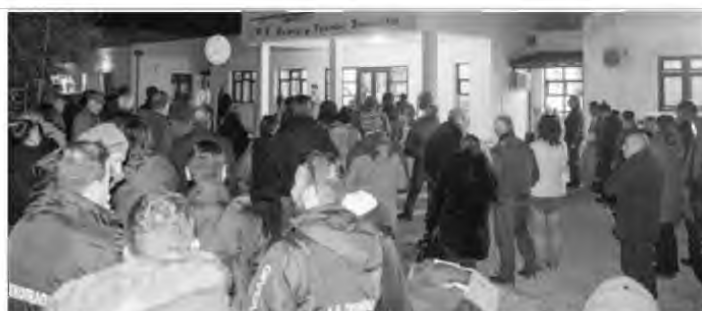
Μαζική κινητοποίηση με αίτημα τη βελτίωση της εικόνας του Κέντρου Υγείας Σκοπέλου