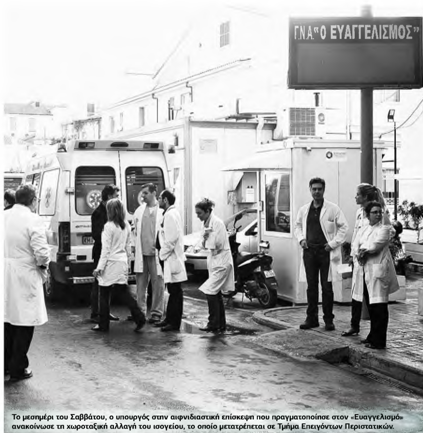
Το μεσημέρι του Σαββάτου, ο υπουργός στην αιφνιδιαστική επίσκεψη που πραγματοποίησε στον «Ευαγγελισμό» ανακοίνωσε τη χωροταξική αλλαγή του ισογείου, το οποίο μετατρέπεται σε Τμήμα Επειγόντων Περιστατικών.

Ο σωστός καταμερισμός των κλινικών που εφημερούν σε όλα τα νοσοκομεία είναι ακόμη μία από τις παρεμβάσεις που σχεδιάζει ο υπουργός Υγείας με τον γενικό γραμματέα, Ιωάννη Κωτσιόπουλο, στην κατεύθυνση βελτίωσης των συνθηκών εφημερίας. Ο τρίτος άξονας των