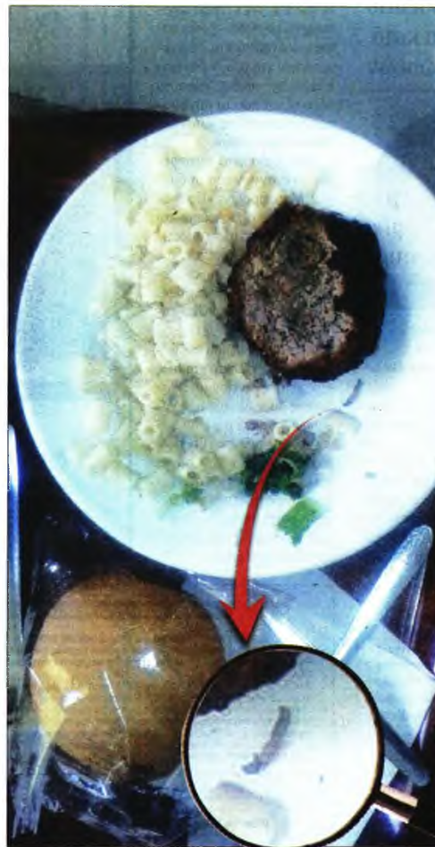
Το μπιφτέκι με το σκουλήκι που σέρβιραν σε ασθενή στο Κρατικό Νικαίας

Η ΠΟΕΔΗΝ αναγνωρίζει ότι ο νεοδιορισμένος διοικητής δεν φέρει ευθύνη και μεταξύ άλλων τονίζει: «Υπάρχουν δεκάδες καταγγελίες. Η τάση που υπήρχε όλα τα προηγούμενα χρόνια ήταν να συγκαλύπτονται τα γεγονότα. Ο θάνατος μιας αποκλειστικής, οι παράνομες καθαίρεσεις, με αποτέλεσμα να χάσει μια συγγενής τη ζωή της, οι σοβάδες που πέφτουν σε κεφάλια ασθενών, τα πλαστά πτυχία του πρώην διοικητή και το σκάνδαλο με την απευθείας ανάθεση του κυλίκιου. Όλα τα συγκάλυπταν» τόνισε ο Μιχάλης Γιαννάκος.