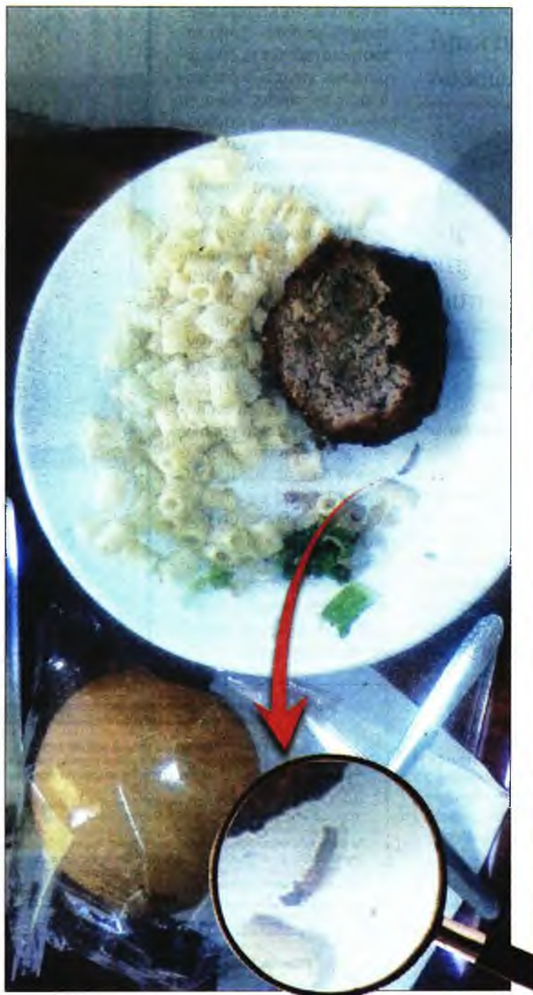
Το μπιφτέκι με το σκουλήκι που σέρβιραν σε ασθενή στο Κρατικό Νικαίας