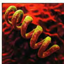
Το βακτηρίο της σύφιλης ή ωχρά σπειροχαιτίτη

Σε κάθε περίπτωση και με την ευχή όλων να συνοδεύει το προσωπικό του νοσοκομείου, θα πρέπει το επίμαχο πάθημα να γίνει μάθημα προτού αντίστοιχες αβλεψίες οδηγήσουν σε τραγικές συνέπειες.