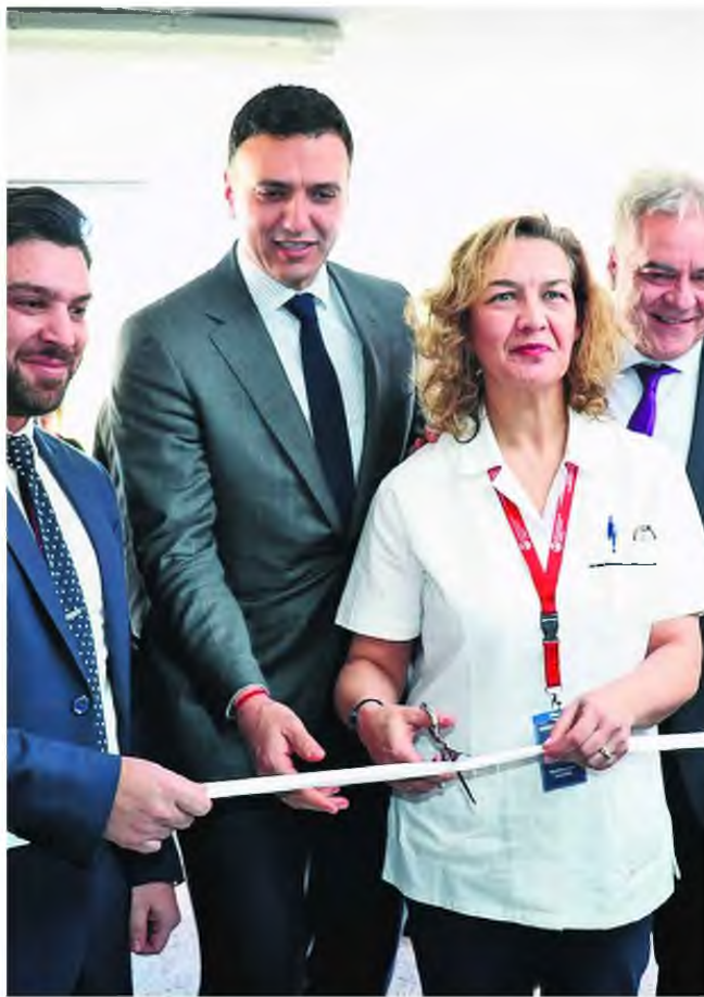
Ο υπ. Υγείας Β. Κικίλιας εγκαινίασε χθες την πλήρως ανακαινισμένη Μονάδα Τεχνητού Νεφρού στο Γενικό Νοσοκομείο Λαμίας.

Στο χαιρετισμό του, ο υπουργός Υγείας ευχαρίστησε εκ μέρους της κυβέρνησης και του Πρωθυπουργού, το ιατρικό, νοσηλευτικό, παραϊατρικό και διοικητικό προσωπικό, που κράτησε όρθιο το Εθνικό Σύστημα Υγείας στα χρόνια της κρίσης, υπό οποιαδήποτε διοίκηση ή πολιτική ηγεσία. Χαρακτή-