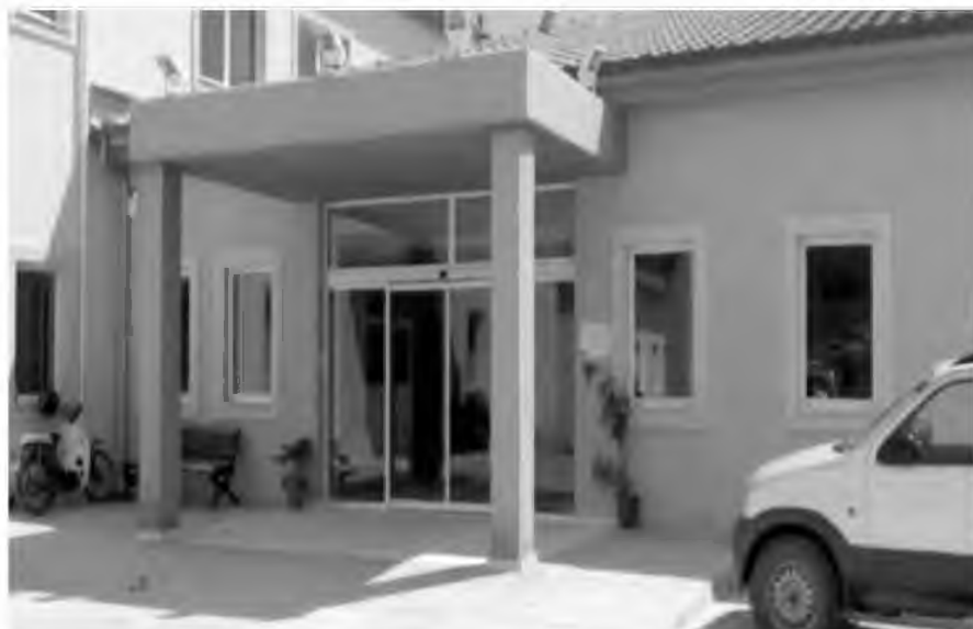
Στα Κέντρα Υγείας, που δεν έχουν κεντρική θέρμανση, περιλαμβάνονται οι δομές στη Σκιάθο και τη Σκόπελο, σύμφωνα με την ανακοίνωση της ΠΟΕΔΗΝ

Σύμφωνα με τους εργαζόμενους στο ΕΣΥ (ΠΟΕΔΗΝ) στα δημόσια νοσοκομεία τα περισσότερα νοσοκομεία φαίνεται ότι έχουν επάρκεια σε πετρέλαιο και πολλά έχουν συνδεθεί με φυσικό αέριο αλλά αντιμετωπίζουν προβλήματα επειδή είναι ασυντήρητα τα κλιματιστικά σώματα ή είναι πολύ παλαιά