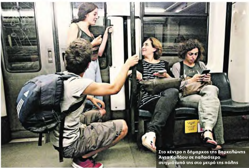
Στο κέντρο η δήμαρχος της Βαρκελώνης Άντα Κολάου σε παλαιότερο στιγμιότυπό της στο μετρό της πόλης

Οι Γερμανικοί Σιδηρόδρομοι ανακοίνωσαν την Τρίτη επενδύσεις 86 δισ. ευρώ μέσα στην επόμενη δεκαετία για να ενισχύσουν την ανταγωνιστικότητά τους έναντι των ρυπογόνων οδικών μεταφορών, των αυτοκινητοδρόμων και των αερομεταφορών, με την κυβέρνηση της Μέρκελ να συμμετέχει με 62 δισ. και τους Γερμανικούς Σιδηρόδρομους με 24 δισ. για την υλοποίηση αυτού του φιλόδοξου σχεδίου.