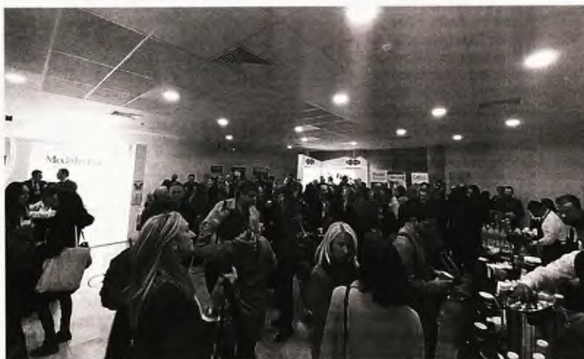
Αποψη από το κατάμεστο Συνεδριακό Κέντρο