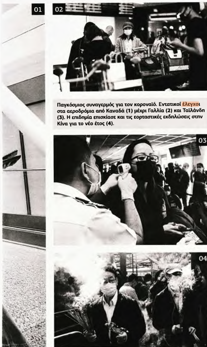
01 02 Παγκόσμιος συναγεμρός για τον κοροναϊό. Εντατικοί έλεγχοι στα αεροδρόμια από Καναδά (1) μέχρι Γαλλία (2) και Ταϊλάνδη (3). Η επιδημία επισκίασε και τις εορταστικές εκδηλώσεις στην Κίνα για το νέο έτος (4).

τα μέτρα που έχει θέσει σε εφαρμογή ο Εθνικός Οργανισμός Δημόσιας Υγείας (ΕΟΔΥ) είναι κυρίως ενημερωτικού χαρακτήρα. Λεπτομερέστερος έλεγχος του γκρουπ φέρεται να πραγματοποιήθηκε στη Ρώμη, που ήταν και η πρώτη είσοδος των επισκεπτών στην Ευρωπαϊκή Ένωση. Σύμφωνα με τους λοιμωξιολόγους του ΕΟΔΥ, ο χρόνος να εκδηλωθεί ο ιός είναι από δύο έως δέκα ημέρες. Συνεπώς, κάποιος μπορεί να έχει κοληθεί τον ιό και να μην εμφανίσει άμεσα συμπτώματα από την πρώτη στιγμή ή τις πρώτες ημέρες. Δεν προβλέπεται, ωστόσο, να απομονωθούν προληπτικά επισκέπτες προερχόμενοι από περιοχές όπου κυκλοφορεί ο ιός, επομένως και το συγκεκριμένο γκρουπ Κινέζων αφέθηκε να συνεχίσει το ταξίδι του. Όπως προκύπτει από τις πληροφορίες μάλιστα, αναμένεται να επιστρέψουν στην Αθήνα αύριο με πλοίο.