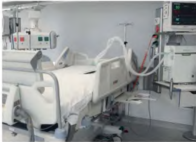
Από τον Οκτώβριο, συνολικά 169 άτομα εισήχθησαν για νοσηλεία σε Μονάδα Εντατικής Θεραπείας λόγω γρίπης.

Στην εβδομαδιαία έκθεση του Εθνικού Οργανισμού Δημόσιας Υγείας που εκδόθηκε χθες, η δραστηριότητα της γρίπης για την περίοδο αυτή χαρακτηρίζεται πολύ υψηλή, με τάση σταθεροποίησης. Οπως επισήμανε στην «Κ» ο παιδίατρος - λοιμωξιολόγος, υπεύθυνος του Τμήματος Επιδημιολογικής Επιτήρησης και Παρέμβασης του Εθνικού Οργανισμού Δημόσιας Υγείας (ΕΟΔΥ) , Θεανώ Γεωργακοπούλου, «παραμένουμε σε περίοδο πολύ υψηλής δραστηριότητας, αλλά τα μηνύματα αυτή τη στιγμή είναι ενθαρρυντικά. Φαίνεται ότι έχουμε “πάσει” την κορυφή