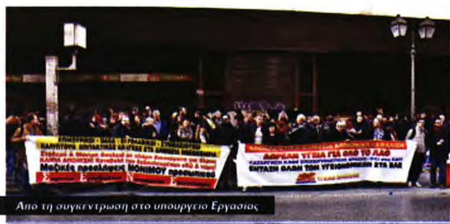
Από τη συγκέντρωση στο υπουργείο Εργασίας

– Οι καθυστερούμενες αποζημιώσεις στις υπερωρίες προσωπικού και οι απλήρωτες εφημερίες γιατρών που εκκρεμούν από το Δεκέμβρη. Από πλευράς υπουργείου, το μπαλάκι πετάχτηκε... στην απειρία των νέων διοικητών, ενώ αναφέρθηκε ότι το θέμα θα λυθεί τις επόμενες μέρες, οπότε θα δοθούν οι προϋπολογισμοί των νοσοκομείων .