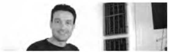
Του Γιώργου Λαμπράκη

Πάλι δεν προβλέπεται για το Αχιλλοπούλειο πρόσληψη μόνιμου οφθαλμιάτρου, όπως επίσης και παιδοχειρουργού. Σε ό,τι αφορά στην πρώτη ειδικότητα, οι ανάγκες θα καλύπτονται από επικουρικό ιατρικό προσωπικό