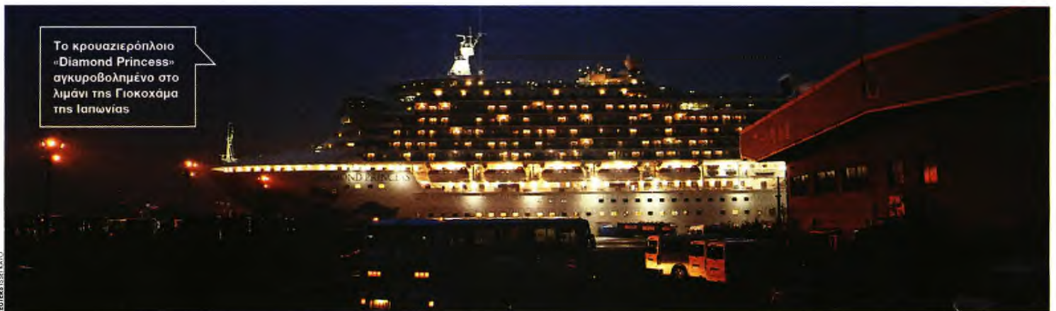
Το κρουαζιερόπλοιο «Diamond Princess» αγκυροβολημένο στο λιμάνι της Γιοκοχάμα της Ιαπωνίας

Τις επόμενες μέρες αναμένεται ο επαναπατρισμός των δύο Ελλήνων που βρίσκονται στο «Diamond Princess», στην Ιαπωνία