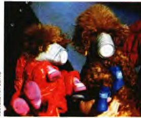
Μέχρι και στα σκυλάκια τους φόρεσαν μάσκες οι κάτοικοι της Σαγκάης

Μέχρι πρότινος τα κινεζικά κρατικά Μέσα τοποθετούσαν τη νωρίτερη άμεση εμπλοκή του Σι σε μια ανακοίνωση που είχε κάνει στις 20 Ιανουαρίου, λίγες ημέρες προτού τεθεί σε καραντίνα η Ουχάν, το σημείο - μηδέν της επιδημίας. Οπως αποκάλυψε ωστόσο μέσα στο Σαββατοκύριακο το ίδιο το επίσημο περιοδικό του ΚΚΚ, το «Κιούσι», ο Σι συναντήθηκε με τη διαρκή επιτροπή του Πολίτη και έδωσε οδηγίες για την αντιμετώπιση του ιού στις 7 Ιανουαρίου – 13 ολόκληρες ημέρες προτού προειδοποιηθούν οι πολίτες για τη σοβαρότητα του θέματος. Στο μεταξύ, στις 18 Ιανουαρίου, παρατέθηκε στην Ουχάν, με τις κυβερνητικές ευλογίες, επίσημο γεύμα για 40.000 οικογένειες. Επιπλέον, αξιωματούχοι από την ευρύτερη επαρχία Χουμπέι συγκεντρώθηκαν εκεί για το ετήσιο συνέδριό τους, ενώ οι Αρχές επιστι-