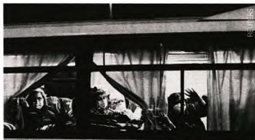
Μέχρι χθες τα κρούσματα κορονοϊού στο κρουαζιερόπλοιο «Diamond Princess» ήταν 355. Όσοι εξακριβώνεται πως έχουν μολυνθεί αποβιβάζονται και διακομίζονται σε ειδικά εξοπλισμένα νοσοκομεία.