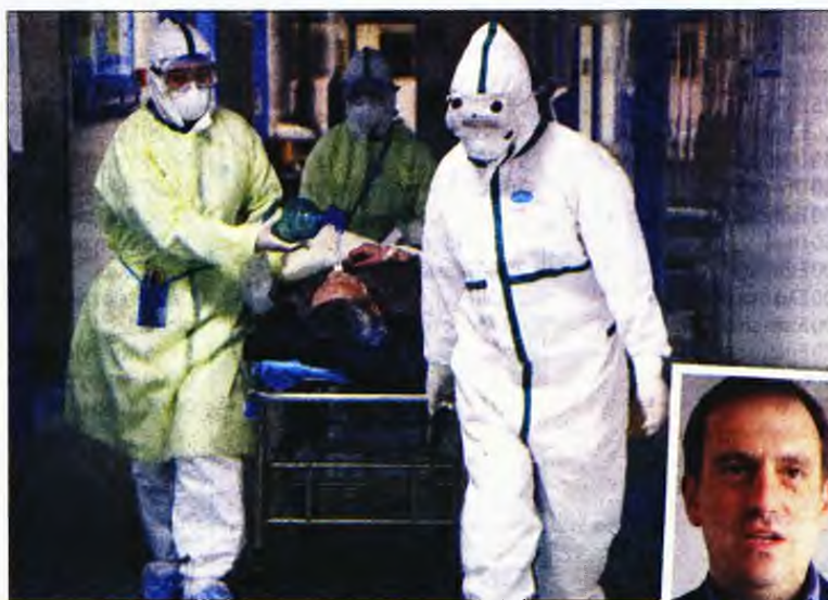
Δεξιά: Ο καθηγητής της Σχολής Δημόσιας Υγείας του Χάρβαρντ Μαρκ Λίπσιτς

Την ίδια ώρα και άλλοι ειδικοί έχουν ήδη προβλέψει ότι ο ιός θα μπορούσε να μολύνει το 60%-80% του πλανήτη, καθώς εκτός από την Κίνα, περιπτώσεις του νέου κορονοϊού έχουν καταγραφεί στις Ηνωμένες Πολιτείες, στην Αγγλία, στον Καναδά, στη Γερμανία, στη Γαλλία και την Αυστραλία.