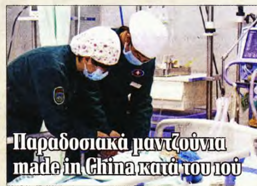
Παραδοσιακά μαντζούνια made in China κατά του ιού

Εξαρχής οι αρμόδιες υπηρεσίες χαρακτήριζαν «χαμηλής υποψίας» για κορονοϊό την περίπτωση των δύο γυναικών, ωστόσο το γεγονός ότι προήλθαν από τη Σιγκαπούρη, που είναι δεύτερη στη λίστα των χωρών με τα περισσότερα κρούσματα μετά την Κίνα, ήταν αρκετό για να σημάνει συναγερμό.