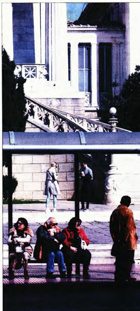
Επιβάτες του ΟΑΣΑ στην αναμονή...

Τα πλοία που θα βρίσκονται σε αυτά τα λιμάνια αναμένεται να αναχωρήσουν μετά τη λήξη της απεργίας, ενώ οι επιβάτες που πρόκειται να ταξιδέψουν καλό είναι πριν από την αναχώρησή τους να επικοινωνούν με τα κατά τόπους λιμενarchεία και τουριστικά πρακτορεία, προκειμένου να ενημερώνονται για τυχόν αλλαγές ή τροποποιήσεις των δρομολογίων.