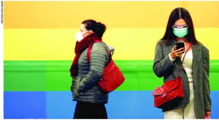
Απώλειες από τον κοροναϊό αντιστοιχούν με το 1% του παγκόσμιου ΑΕΠ προβλέπει το ήπιο σενάριο της Παγκόσμιας Τράπεζας. Στη φωτογραφία, κόσμος, χθες, σε στάση του μετρό στο Μιλάνο.

Εν τω μεταξύ, οι απώλειες στις αγορές μετοχών συνεχίζονται και χθες, αν και σε ηπιότερο ρυθμό, παρά το γεγονός ότι κάποια χρηματιστήρια της Ασίας κατά-