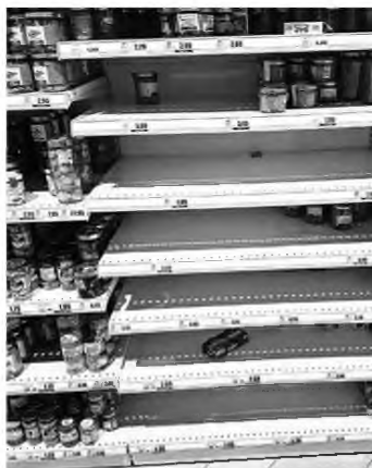
Περιοχές στον Ιταλικό Βορρά ερήμωσαν και τα ράφια των σούπερ μάρκετ έχουν αδειάσει, την ώρα που η αισχροκέρδεια καλπάζει.