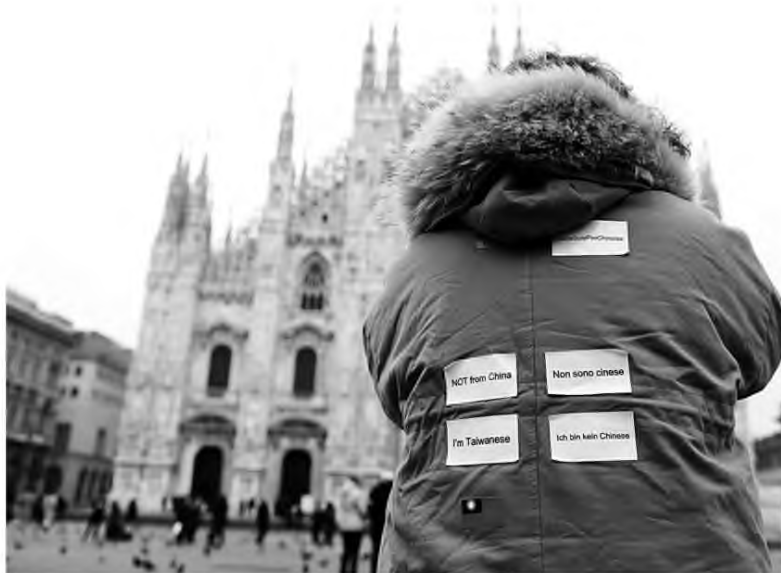
Ενδεικτική του κλίματος φόβου που οδηγεί σε ρατσιστικές συμπεριφορές η ανάγκη που οδήγησε τον άνδρα από την Ταϊβάν να «δηλώσει» σε πολλές γλώσσες πως δεν είναι Κινέζος.

Οι ιταλικές αρχές έχουν ξεκινήσει έρευνα για τα ανεξέλεγκτα ύψη που έχουν φτάσει οι τιμές στο Διαδίκτυο για τις μάσκες προστασίας και τα απολυμαντικά τζελ, αφού το στοκ των φαρμακείων τελείωσε πολύ γρήγορα, και πολλοί έσπευσαν να εκμεταλλευτούν την ευκαιρία πουλάοντας τα στο Διαδίκτυο. Χθες, στη διαδικτυακή πλατφόρμα «E-bay» η μάσκα κόστιζε 10 ευρώ (από 0,1 ευρώ) και τα 250 ml απολυμαντικού τζελ πωλούνταν 50 ευρώ, από επτά που είναι η τιμή του κανονικά. Η τιμή του λίτρου εκτοξεύεται στα 799 ευρώ. Μάλιστα, κάποιος απατεώνας, υποδούμενος επιθεωρητές υγείας χρησιμοποιούν πλαστές ταυτότητες για να αποκτήσουν πρόσβαση στα σπίτια πολιτών και να κλέψουν χρήματα ή τιμαλφή. ■