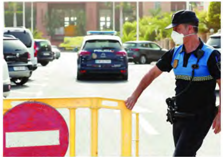
Οι υγειονομικές αρχές της Ισπανίας χθες εντόπισαν ένα κρούσμα του νέου κοροναϊού στην Καταλονία.

και στην Ευρώπη, όπου οι βασικοί χρηματιστηριακοί δείκτες υποχωρούσαν ενδοσυνεδριακά περισσότερο από 1,5%. Θετική εξαίρεση αποτέλεσε και το ελληνικό Χρηματιστήριο, καθώς ο γενικός δείκτης κατάφερε να ανακάμψει από την προχθεσινή ελεύθερη πτώση, κλείνοντας με άνοδο 1,89% στις 833,81 μονάδες. Εν τω μεταξύ, σε αυξημένη ετοιμότητα είναι η κυβέρνηση και οι αρμόδιες υπηρεσίες. Για τη λήψη μέτρων αποφυγής και τον περιορισμό διάδοσης του κοροναϊού εκδόθηκε χθες Πράξη Νομοθετικού Περιεχομένου. Στα συναρμόδια υπουργεία έχει σχηματιστεί task force, ενώ συνεχής είναι η επικοινωνία όχι μόνο με τον Παγκόσμιο Οργανισμό Υγείας, αλλά και με τα αρμόδια όργανα της Ε.Ε. σελ. 4-5