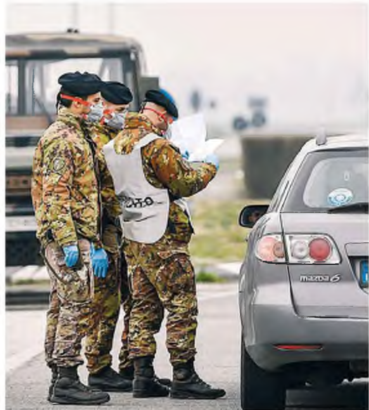
Ιταλοί στρατιώτες ελέγχουν ταξιδιώτες που φεύγουν από περιοχή της βόρειας Ιταλίας, όπου βρίσκεται το επίκεντρο της επιδημίας.

Στην Ιταλία, η ανησυχία αυξάνεται μαζί με τον αριθμό των κρουσμάτων που ανέρχονται πλέον σε 322. Νέα κρούσματα καταγράφηκαν και σε περιοχές της νότιας Ιταλίας, όπου οι Αρχές καλούν τους ταξιδιώτες που προέρχονται από τη Λομβαρδία και το Βένετο, όπου φαίνεται πως βρίσκεται το επίκεντρο της επιδημίας, να αναφέρουν την άφιξή τους στις υγειονομικές αρχές.