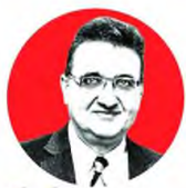
ΑΘΑΝΑΣΙΟΣ ΞΕΣΑΔΑΚΤΥΛΟΣ ΠΡΟΕΔΡΟΣ ΤΟΥ ΠΑΝΕΛΛΗΝΙΟΥ ΙΑΤΡΙΚΟΥ ΣΥΛΛΟΓΟΥ

Το 90% των κρουσμάτων δεν εντοπίζεται από τις θερμικές κάμερες