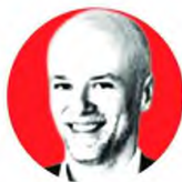
ΓΙΑΝΝΗΣ ΡΕΤΣΟΣ, ΠΡΟΕΔΡΟΣ ΤΟΥ ΣΕΤΕ