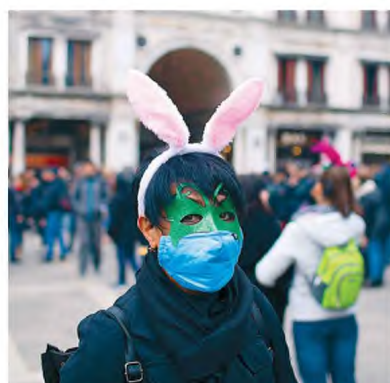
Μασκαράδες και ταυτόχρονα... μασκαροφόροι φρέτος στη Βενετία, λόγω της επιδημίας. Με κοινή υπουργική απόφαση ματαιώνονται οι εκδηλώσεις για το καρναβάλι στην Ελλάδα, στο πρώτο και άλλων ευρωπαϊκών χωρών.