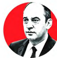
Ο υπουργός Ναυτιλίας, Γιάννης Πλάκιωτάκης , κατά τη διάρκεια του Υπουργικού Συμβουλίου, έλαβε εντολές για εντατικότερη φύλαξη των θαλάσσιων συνόρων.

Στην ημερήσια διάταξη του Υπουργικού Συμβουλίου ήταν η παρουσίαση νομοσχεδίου του υπουργείου Οικονομικών για την εταιρική διακυβέρνηση, η παρουσίαση νομοσχεδίου του υπουργείου Παιδείας και Θρησκευμάτων για ζητήματα πρωτοβάθμιας, δευτεροβάθμιας και τριτοβάθμιας εκπαίδευσης, η παρουσίαση νομοσχεδίου του υπουργείου Περιβάλλοντος και Ενέργειας, καθώς και η παρουσίαση νομοθετικών πρωτοβουλιών του υπουργείου Μετανάστευσης και Ασύλου για όσα συμβαίνουν στα νησιά του Ανατολικού Αιγαίου.