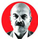
ΛΥΣΑΝΔΡΟΣ ΤΣΙΛΙΑΛΗΣ, ΠΡΟΕΔΡΟΣ ΟΜΟΣΠΟΝΔΙΑΣ ΗΑΤΤΑ