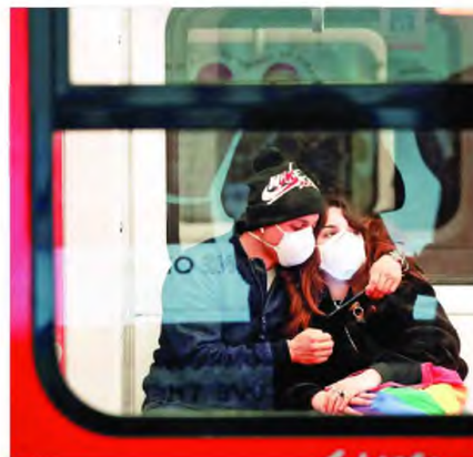
Φοβισμένοι και με μάσκες κυκλοφορούν οι κάτοικοι της Ιταλίας.