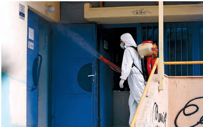
Απολύμανση στο 12ο Ενιαίο Λύκειο Θεσσαλονίκης, χθες, ως μέτρο πρόληψης για τον κορωνοϊό.

Το τρίτο περιστατικό της χώρας μας αφορά Ελληνίδα κάτοικο Αμαρσορίου, τραπεζικό στελέχη, η οποία επέστρεψε πρόσφα-