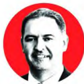
ΑΛΕΞΑΝΔΡΟΣ ΒΑΣΙΛΙΟΥΣ, ΠΡΟΕΔΡΟΣ ΤΟΥ ΣΕΕ