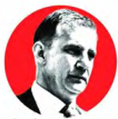
ΘΑΝΟΣ ΔΗΜΟΠΟΥΛΟΣ ΚΑΘΗΓΗΤΗΣ ΙΑΤΡΙΚΗΣ ΑΘΗΝΑΣ ΚΑΙ ΠΥΡΥΤΑΝΗΣ ΤΟΥ ΠΑΝΕΠΙΣΤΗΜΙΟΥ ΑΘΗΝΩΝ

Το 90% των κρουσμάτων δεν εντοπίζεται από τις θερμικές κάμερες