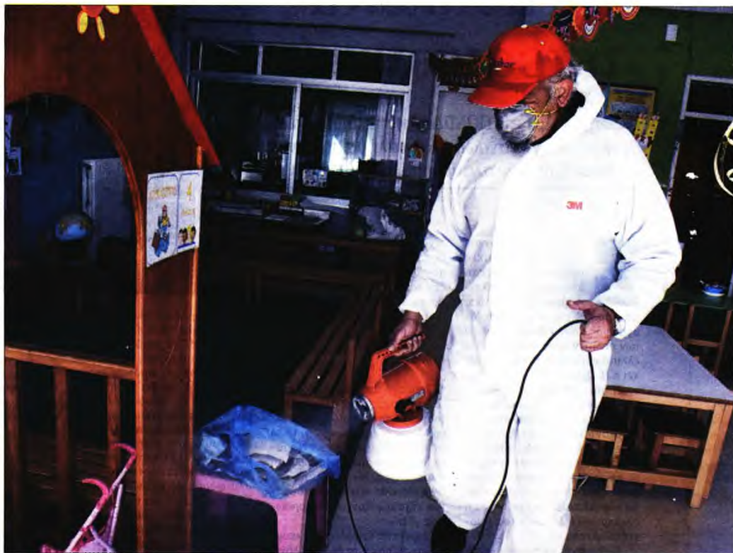
Συνεργείο στην απολύμανση αιθουσών νηπιαγωγείου

Αξίζει να αναφερθεί ότι ο κ. Τσιόδρας σε δηλώσεις του σε τηλεοπτικό σταθμό επανέλαβε ότι «πανικός είναι κακός σύμβουλος σε αυτή την κρίση», ωστόσο τόνισε πως σε κάθε περίπτωση η περαιτέρω διασπορά του ιού απασχολεί τους ειδικούς. Ο ίδιος πρότεινε τον κόσμο να ακολουθεί τις οδηγίες των ειδικών, όπως την τήρηση των κανόνων υγιεινής. Επιπλέον, συμβούλεψε όσους ήρθαν από την Ιταλία να παρακολουθούν την υγεία τους και αν παρουσιάσουν ύποπτα συμπτώματα, όπως πυρετό, πονόλαιμο, καταρροή και αδυναμία του οργανισμού, να επικοινωνήσουν με τον ΕΟΔΥ για να προχωρήσουν στις απαραίτητες εξετάσεις.