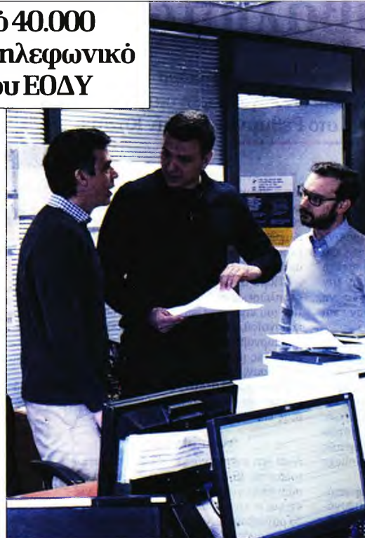
Από την επίσκεψη του Β. Κικιλια στο Κέντρο Επιχειρήσεων του Εθνικού Οργανισμού Δημόσιας Υγείας

Επίσης, ο υπουργός Υγείας επισκέφθηκε το μεσημέρι της Κυριακής το Νοσοκομείο «Σωτηρία» (ένα από τα νοσοκομεία αναφοράς για τον κορονοϊό), όπου μίλησε με γιατρούς και νοσηλευτές, εξήρε τις προσπάθειές τους και ενημερώθηκε για την κατάσταση των δύο ασθενών που έχουν