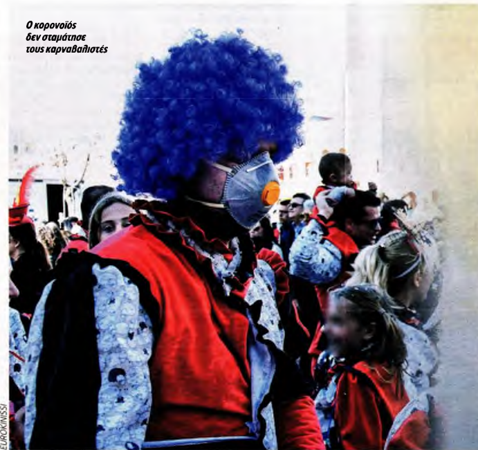
Ο κορονοϊός δεν σταμάτησε τους καρναβαλιστές

Στο τρίτο μέτωπο είναι προφανείς όχι μόνο η κρισιμότητα αλλά και η ανάγκη ενημέρωσης των πολιτών, όπως προκύπτει από τις περισσότερες από 40.000 κλήσεις που έχει δεχθεί το τηλεφωνικό κέντρο του ΕΟΔΥ τις τελευταίες μέρες. Για τον λόγο αυτό με ηλεκτρονικό μήνυμα εκ μέρους του υπουργείου Υγείας από την Κυριακή το βράδυ οι φορολογούμενοι ενημερώνονται για τον νέο κορονοϊό από την Ανεξάρτητη Αρχή Δημοσίων Εσόδων (ΑΑΔΕ). Η ενημέρωση είναι στη μορφή 15 ερωτήσεων-απαντήσεων για τον νέο κορονοϊό και έρχεται στην ηλεκτρονική διεύθυνση που έχει δηλωθεί στο Taxisnet. Στόχος των ειδικών είναι να έχει ο κόσμος την έγκυρη και αξιόπιστη πληροφόρηση που χρειάζεται προκειμένου να προστατεύσει τον εαυτό του και τους γύρω του, με έμφαση στους ηλικιωμένους που μαζί με τους χρονίως πάσχοντες είναι οι περισσότερο ευάλωτοι απέναντι στον νέο κορονοϊό.