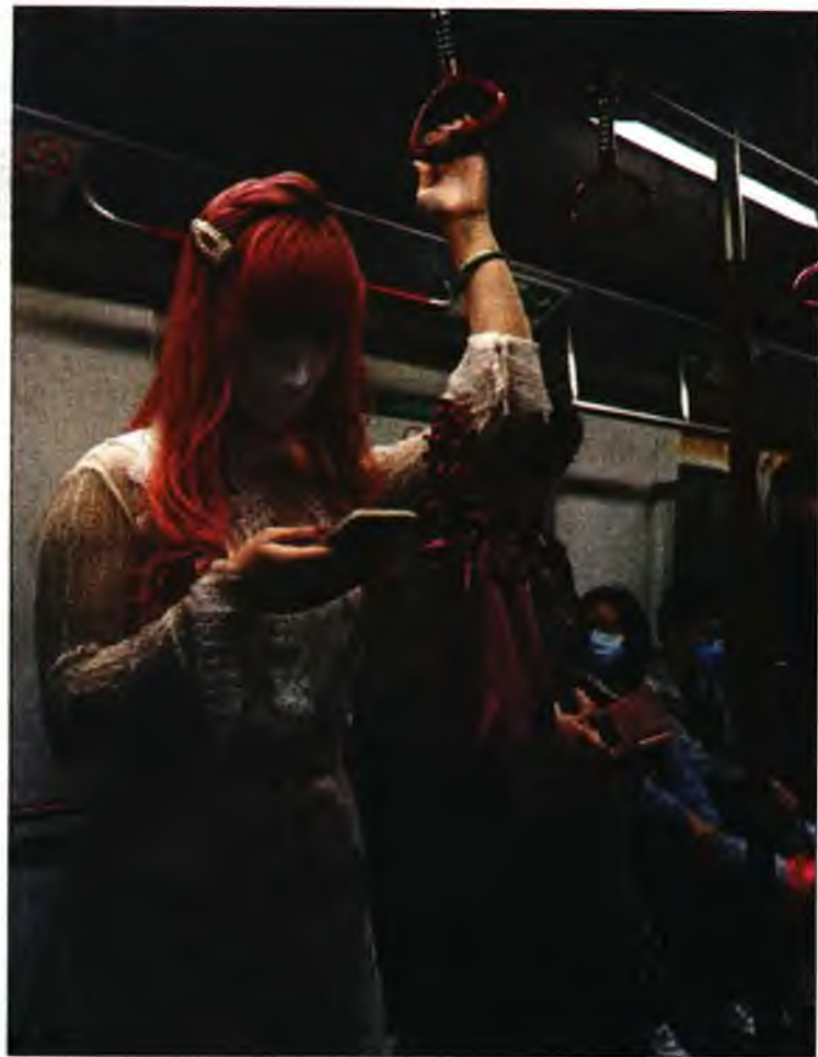
Κινέζοι στο μετρό του Χονγκ Κονγκ με μάσκες

μό να ανέρχεται σε 4.335. Η δημαρχία της Σεούλ υπέβαλε μήνυση εναντίον ηγετικών στελεχών της Εκκλησίας της Σιντσεονζί του