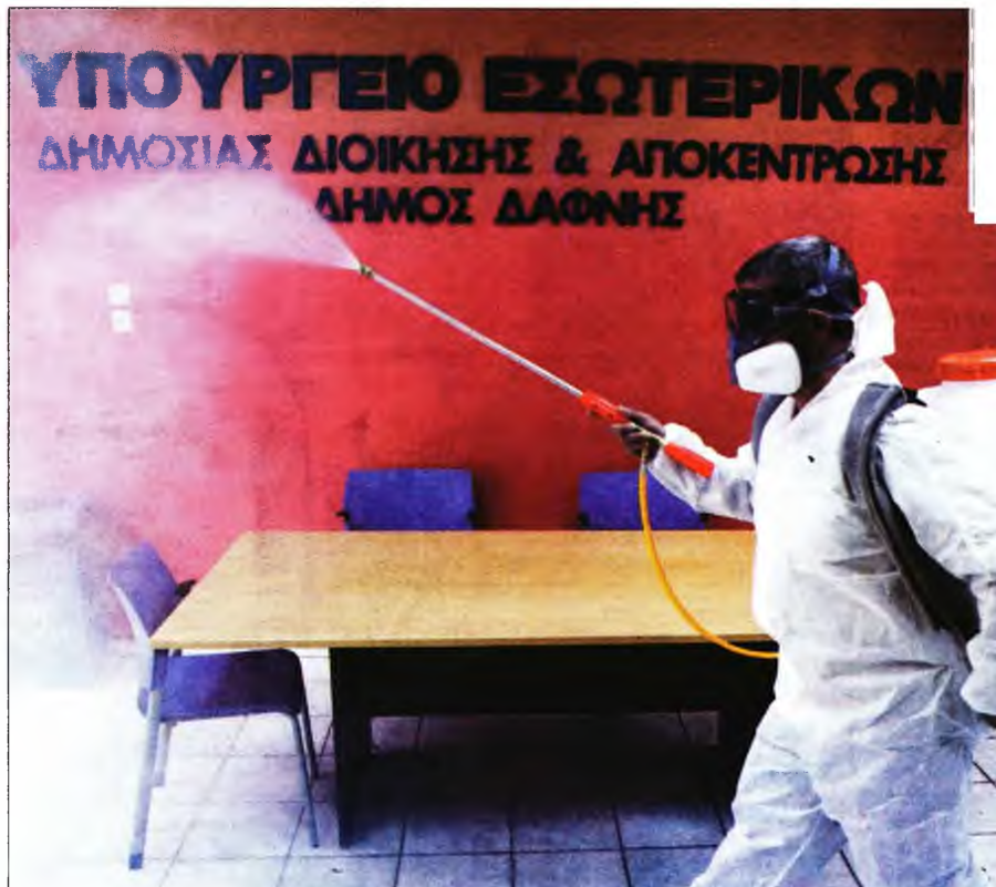
Απολύμανση σε υπηρεσία του Δήμου Δάφνης

Την ίδια στιγμή, στο κλείσιμο του καταστήματος της αλυσίδας σου-