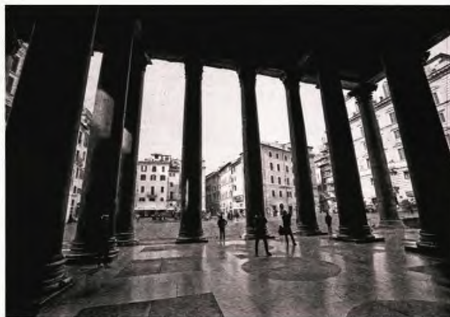
Τρεις... και ο κούκος στο Πάνθεον στη Ρώμη

στο νοσοκομείο της Πιατσέντσα, στον ιταλικό Βορρά, κάθε μέρα εισάγονται σαράντα νέοι ασθενείς με επιπλοκές λόγω πνευμονίας. Και οι πολιτικοί, σε μια προσπάθεια να πείσουν όλους τους Ιταλούς να ακολουθήσουν τις οδηγίες