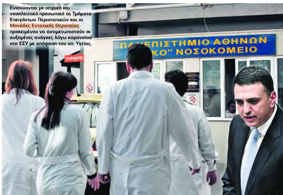
Ενισχύονται με ιατρικό και νοσηλευτικό προσωπικό τα Τμήματα Επείγοντων Περιστατικών και οι Μονάδες Εντατικής Θεραπείας προκειμένου να αντιμετωπιστούν οι αυξημένες ανάγκες λόγω κορονοϊού στο ΕΣΥ με απόφαση του υπ. Υγείας.

ΚΙΚΙΛΙΑΣ: ΕΝΙΣΧΥΣΗ ΤΟΥ ΥΠΟΥΡΓΕΙΟΥ ΥΓΕΙΑΣ ΜΕ 15 ΕΚΑΤ.