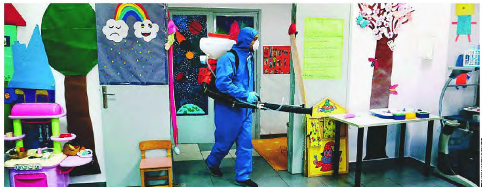
Οι αρμόδιες αρχές προχωρούν τις τελευταίες ημέρες σε απολύμανση στους χώρους σχολείων σε διάφορες περιοχές της χώρας, στο πλαίσιο προληπτικών μέτρων αποτροπής της μετάδοσης.