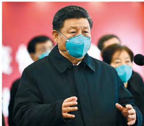
Μια αχνή ελπίδα ανατέλλει στην Κίνα. Χθες, ο πρόεδρος Σι Τζινπίνγκ επισκέφθηκε για πρώτη φορά τη Γουκάν, την πόλη από όπου άρχισαν όλα, και δεσμεύθηκε ότι ο πόλεμος κατά του ιού θα συνεχιστεί μέχρι την οριστική νίκη.