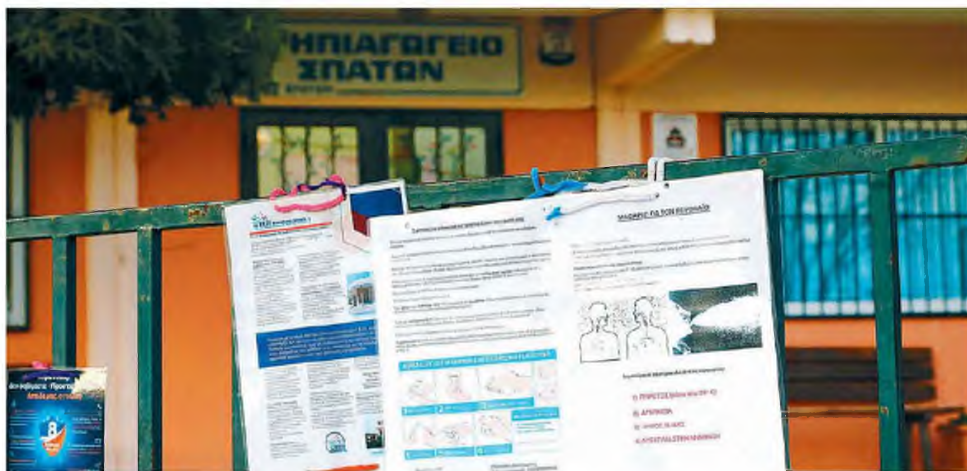
Η απόφαση άμεσης αναστολής της λειτουργίας όλων των εκπαιδευτικών ιδρυμάτων αφορά τους βρεφονηπιακούς σταθμούς, τα σχολεία, τα ΙΕΚ, τα ΑΕΙ, σχολεία δεύτερης ευκαιρίας, κέντρα διά βίου μάθησης και τα φροντιστήρια.

βριο. Ειδικότερα, χθες, ο υπουργός Υγείας Βασ. Κικίλιας μετά εισήγηση της αρμόδιας επιτροπής εμπειρογνομητών, ανακοίνωσε την άμεση αναστολή της λειτουργίας όλων των εκπαιδευτικών ιδρυμάτων της χώρας για 14 ημέρες, σε δημόσιο και ιδιωτικό τομέα. Δηλαδή, η απόφαση αφορά τους βρεφονηπιακούς σταθμούς, τα σχολεία, τα ΙΕΚ, τα ΑΕΙ, σχολεία δεύτερης ευκαιρίας, κέντρα διά βίου μάθησης και τα φροντιστήρια, και καλύπτει και τις αποφάσεις πολλών δήμων όπου έκλεισαν σχολεία ή υπέβαλαν σχετικά αιτήματα. Όπως ανακοινώθηκε, «οι δομές αναστέλλουν τη διά ζώσης εκπαιδευτική διαδικασία (αλλά όχι και την εξ αποστάσεως), καθώς και συναθροίσεις, όπως σε εστιατόρια,