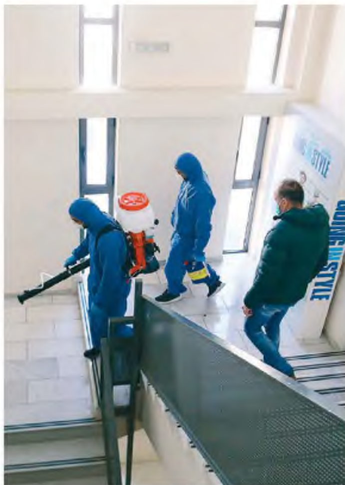
Απολύμανση πραγματοποιήθηκε χθες σε σχολείο της Αγ. Παρασκευής.

Με βάση τα δεδομένα της Κίνας και τις εκτιμήσεις των εμπειρογνομώνων του Ευρωπαϊκού Ελέγχου Πρόληψης Νοσημάτων για τη χώρα μας, αναμένεται στην Ελλάδα έξαρση της νόσου σε περίπου 3 με 4 εβδομάδες. Σύμφωνα με τους ειδικούς, «είναι πιθανόν σε κάποια φάση να κολλήσουμε όλοι. Το θέμα είναι να μην κολλήσουμε όλοι μαζί». Συνήθως οι ιοί υποχωρούν όταν συναντούν τείχος ανοσίας από το 60% του πληθυσμού που έχει ήδη νοσήσει. Στην περίπτωση που επιβεβαιωθούν οι εκτιμήσεις ότι ο νέος κορωνοϊός «πεθαίνει» σε θερμοκρα-