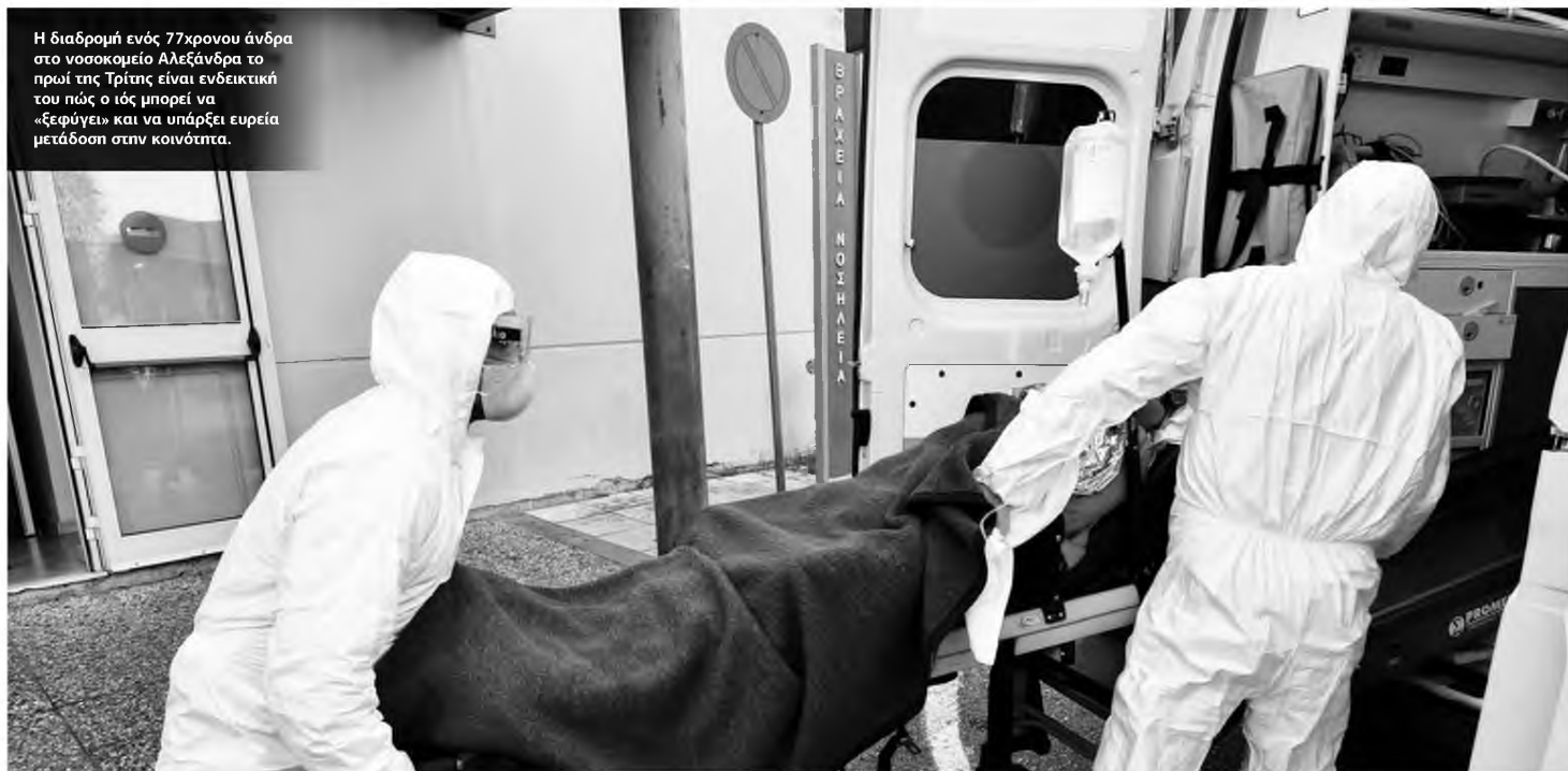
Η διαδρομή ενός 77χρονου άνδρα στο νοσοκομείο Αλεξάνδρα το πρωί της Τρίτης είναι ενδεικτική του πώς ο ιός μπορεί να «ξεφύγει» και να υπάρξει ευρεία μετάδοση στην κοινότητα.

77ΧΡΟΝΟΣ ΝΟΣΗΛΕΥΤΗΚΕ ΣΤΗΝ ΠΑΘΟΛΟΓΙΚΗ ΤΟΥ «ΑΛΕΞΑΝΔΡΑ» ΚΑΙ ΔΙΕΚΟΜΙΣΘΗ ΣΤΟ «ΣΩΤΗΡΙΑ» ΩΣ ΝΕΟ ΚΡΟΥΣΜΑ