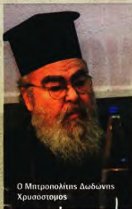
Ο Μητροπολίτης Δωδώνης Χρυσόστομος

ΥΠΕΡ ΤΗΣ κυβερνητικής απόφασης να «κλείσει» τις εκκλησίες τάχθηκε χθες ο μητροπολίτης Δωδώνης Χρυσόστομος. Όπως είπε μιλώντας στον ΣΚΑΪ, «Η Εκκλησία είναι υποχρεωμένη να ακούει και την πολιτεία και το λαό». «Αν χρειαστεί, θα κάνω κι εγώ Πάσχα μακριά από την εκκλησία, γιατί δεν μπορούμε να κάνουμε διαφορετικά». Όσον αφορά στην απόφαση της Διαρκούς Ιεράς Συνόδου, ο Μητροπολίτης Χρυσόστομος διευκρίνισε ότι η Εκκλησία είναι υποχρεωμένη να ακούει και την πολιτεία και τον λαό, προσθέτοντας ότι το θέμα είναι λεπτό. «Εμείς δεν μπορούμε να πάρουμε αποφάσεις "αποφασίζω, διατάσσω και κλείνω"» ανέφερε χαρακτηριστικά.