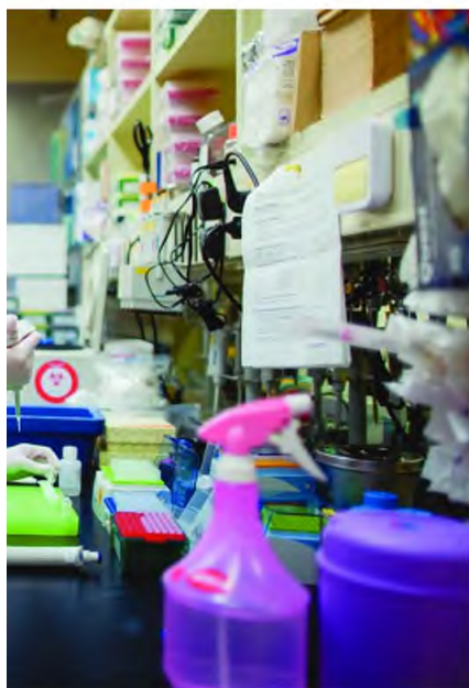
Μάχη με τον χρόνο δίνουν φαρμακευτικές και ερευνητικά κέντρα σε όλο τον κόσμο στην προσπάθειά τους για την παρασκευή εμβολίου κατά του κορωνοϊού

Γουάιν της Κίνας. Στην τρίτη φάση κάθε κλινικής δοκιμής ενός φαρμάκου συμμετέχουν εκατοντάδες ή και χιλιάδες άνθρωποι και η διαδικασία μπορεί να κρατήσει μέχρι και 2 χρόνια.