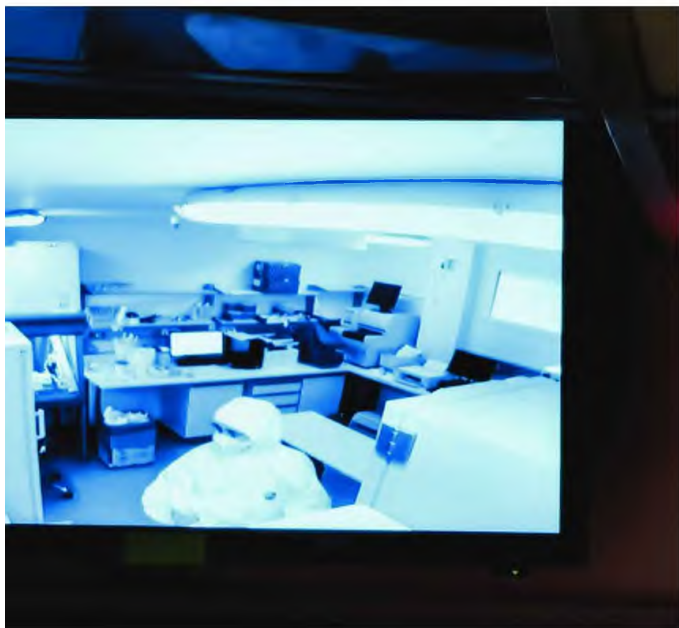
Μέσα στα ειδικά ψυγεία του Εργαστηρίου Βιοασφάλειας επιπέδου 3 και σε αποστειρωμένα φιαλίδια βρίσκονται τα θετικά δείγματα του κορωνοϊού και κάποια επιλεγμένα αρνητικά