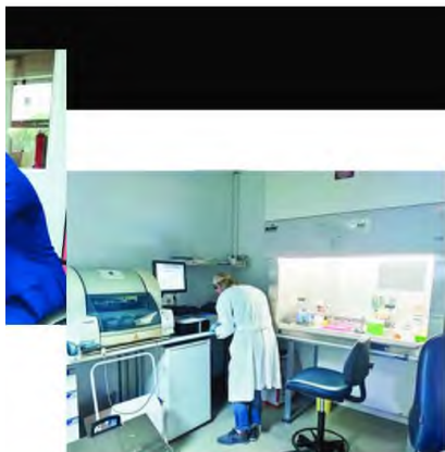
Οι μικροβιολόγοι του Ινστιτούτου έχουν χωρίσει σε βάρδιες, οι πρώτοι έρχονται χωρίς το πρωί και κάθονται έως τις 6 το απόγευμα, και εκείνοι που έρχονται λίγο αργότερα τα πρωινά εργάζονται αδιαμαρτύρητα έως τις 11 και 12 τα μεσάνυχτα