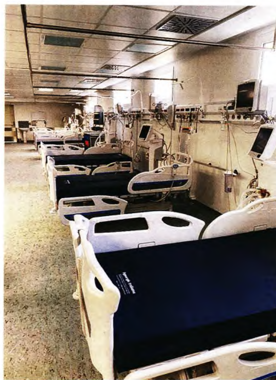
Η νέα ΜΕΘ του ΑΧΕΠΑ με 17 κλινές.

Στο μεταξύ, νέα Μονάδα Εντατικής Θεραπείας διαθέτει το νοσοκομείο ΑΧΕΠΑ. Την έναρξη της λειτουργίας ανακοίνωσε